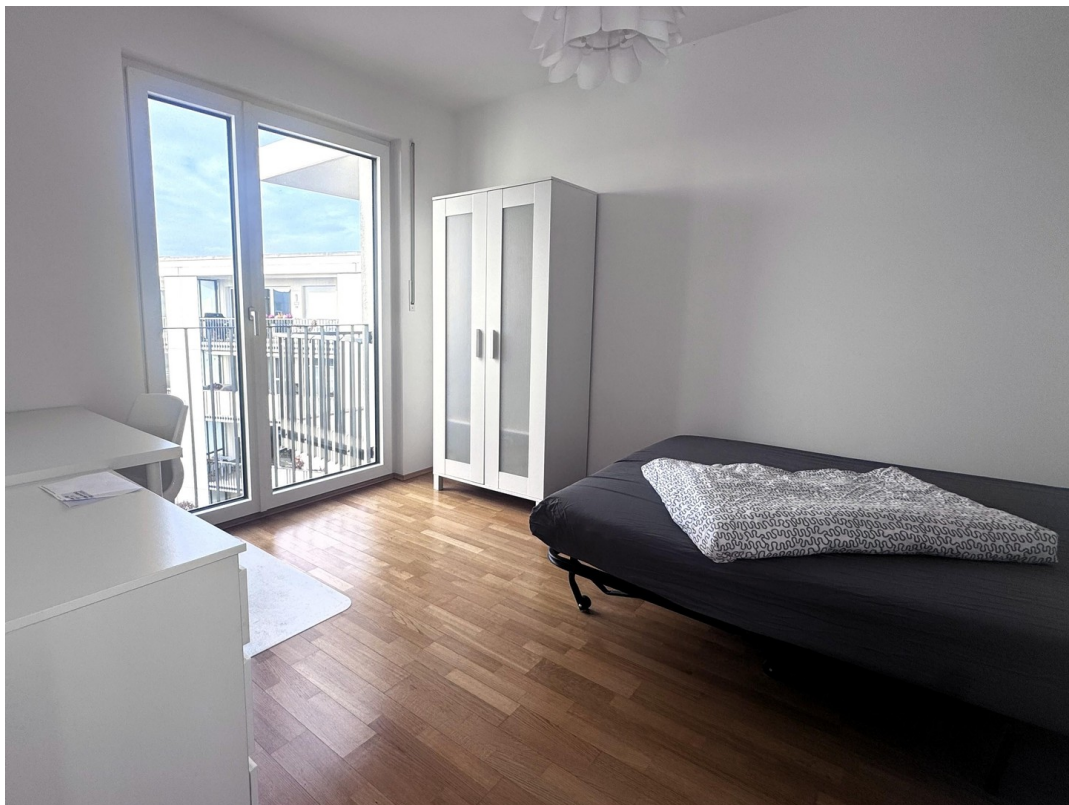
Büro / Kinderzimmer