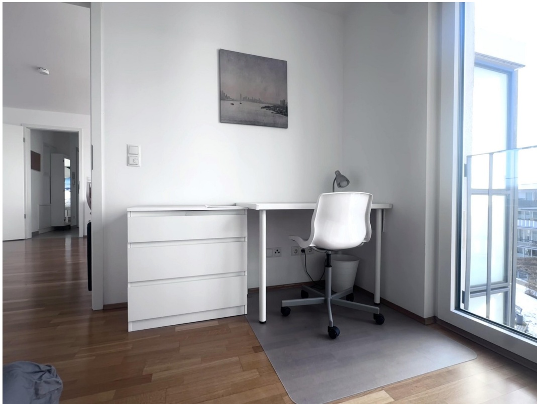
Büro / Kinderzimmer