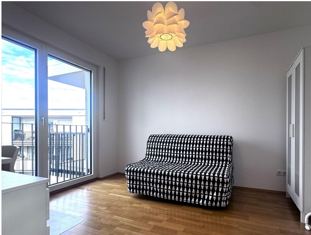
Büro / Kinderzimmer