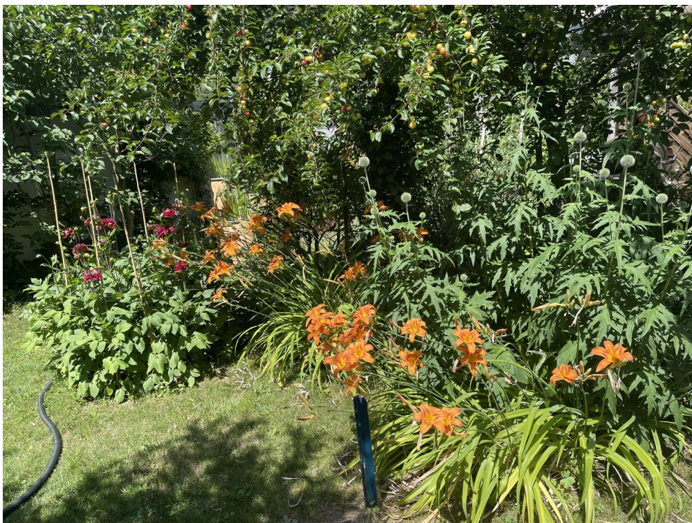
Garten im Sommer