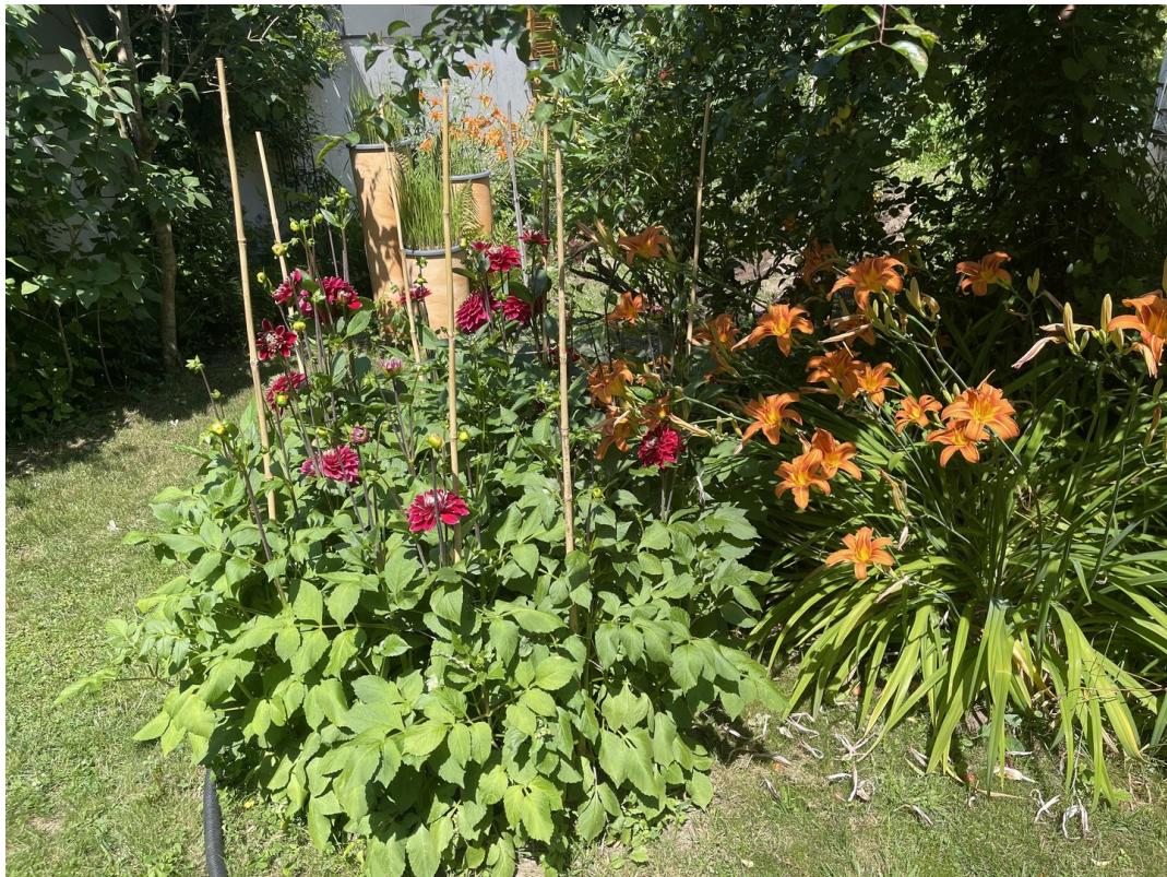
Garten im Sommer