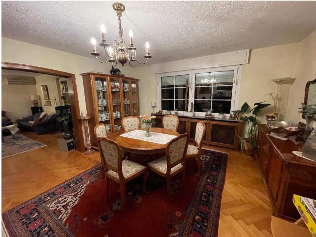
Esszimmer, hinten Wohnzimmer