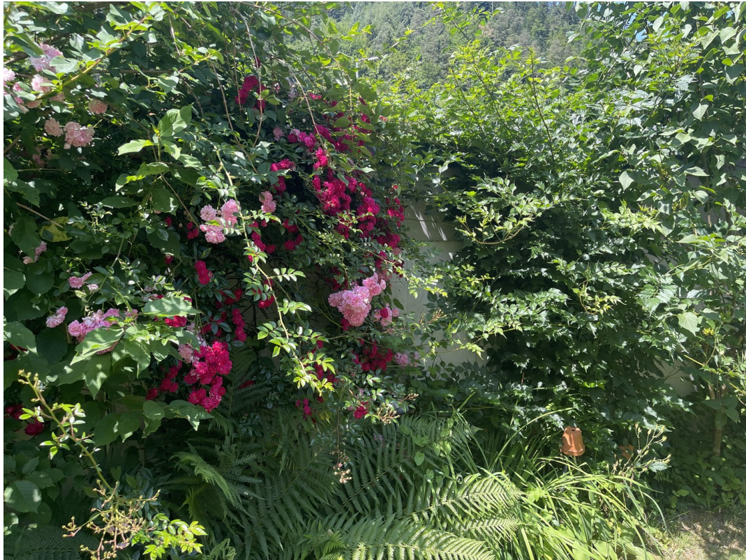
Garten im Sommer