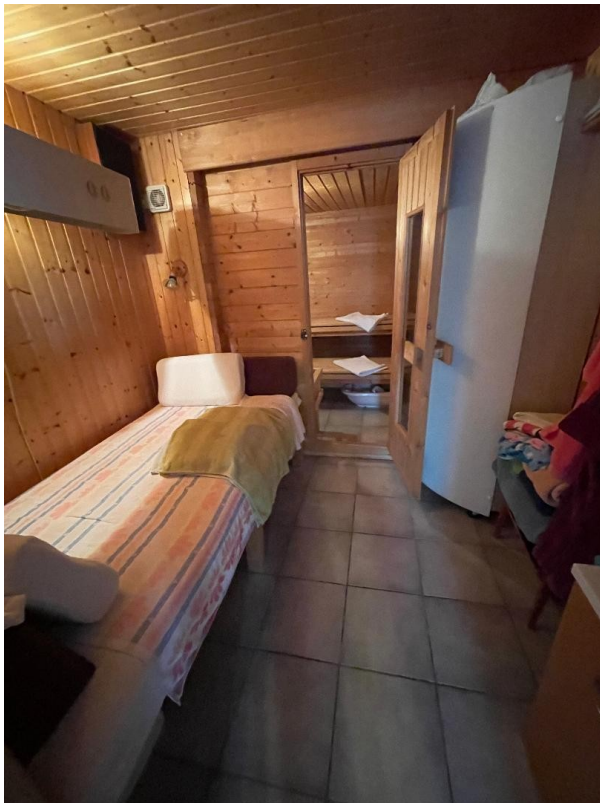
Sauna und Ruheraum