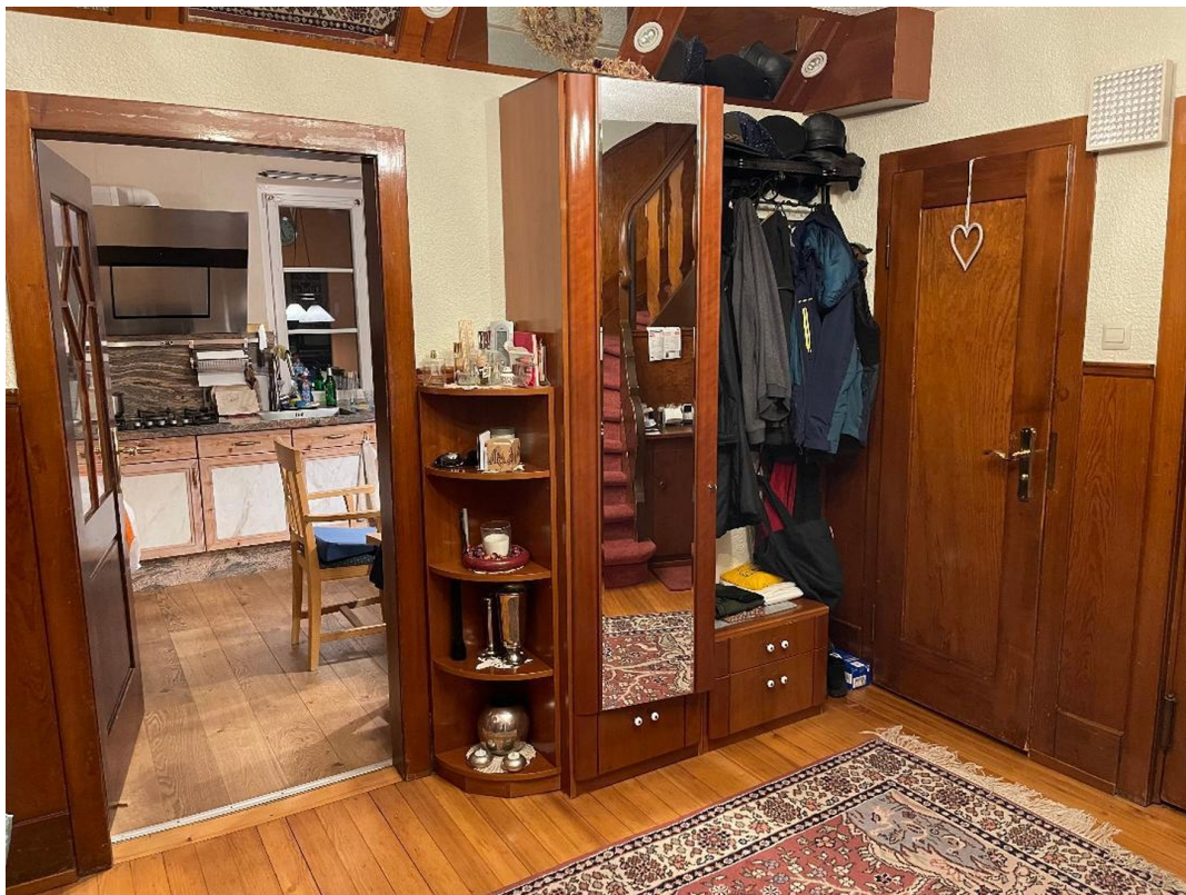
Gäste WC (rechts), vorne Küche