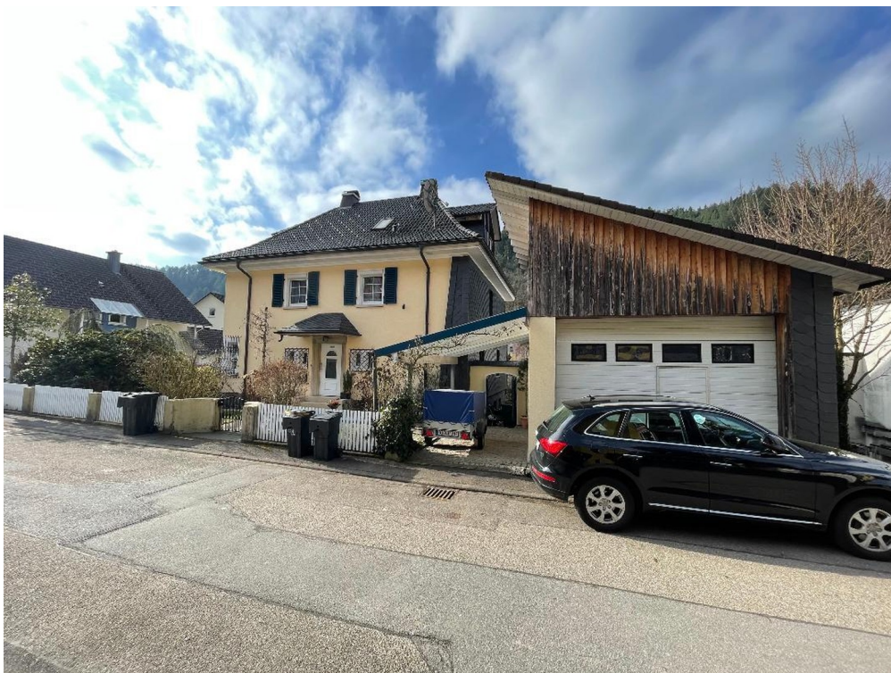
Garage und Carport