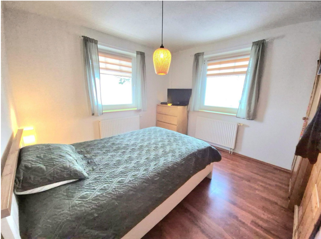
2. Schlafzimmer unten