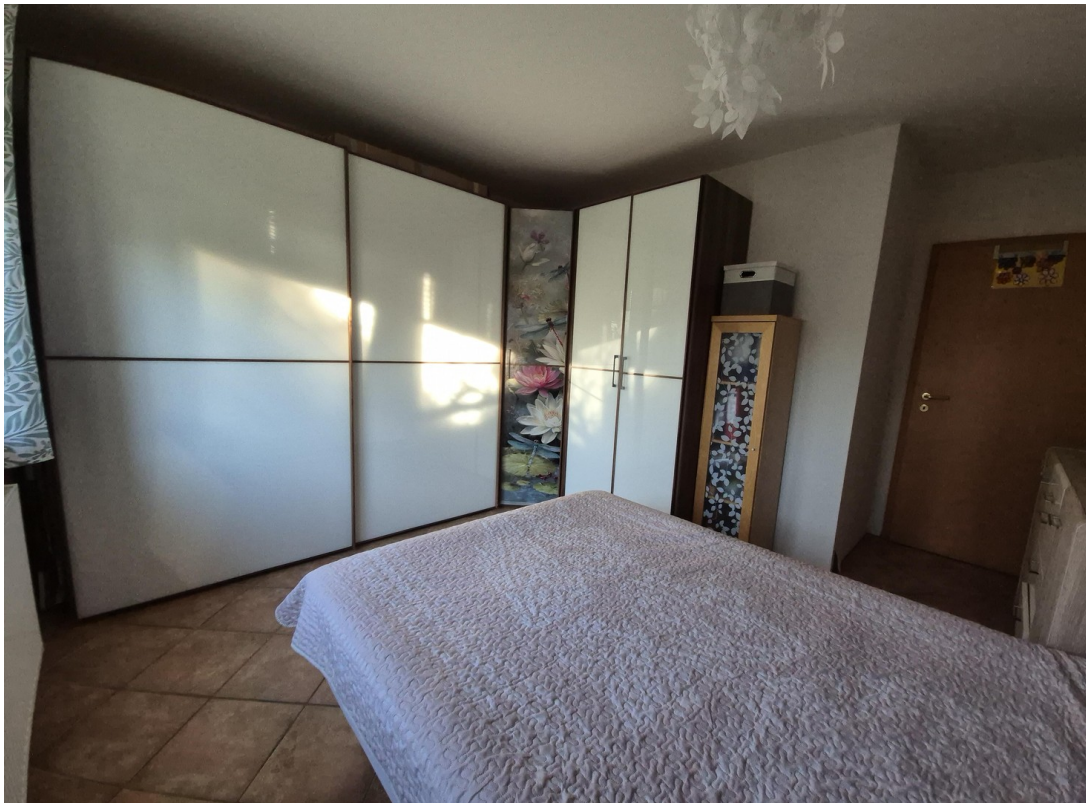
1. Schlafzimmer unten