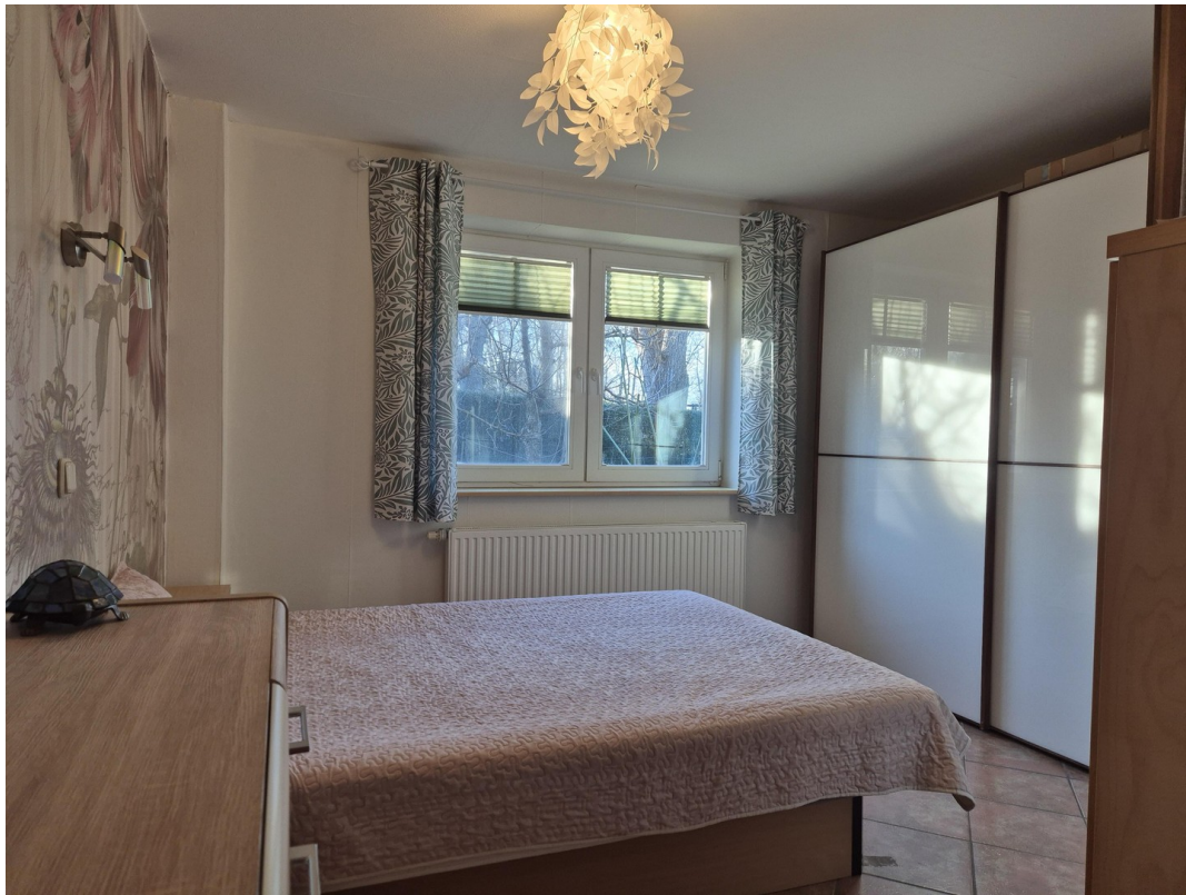
1. Schlafzimmer unten