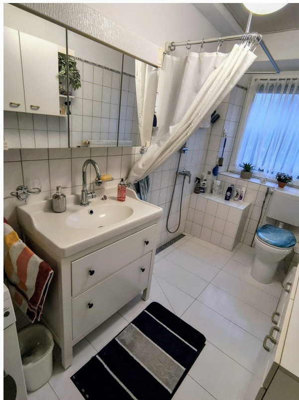
Bad mit ebenerdiger Dusche