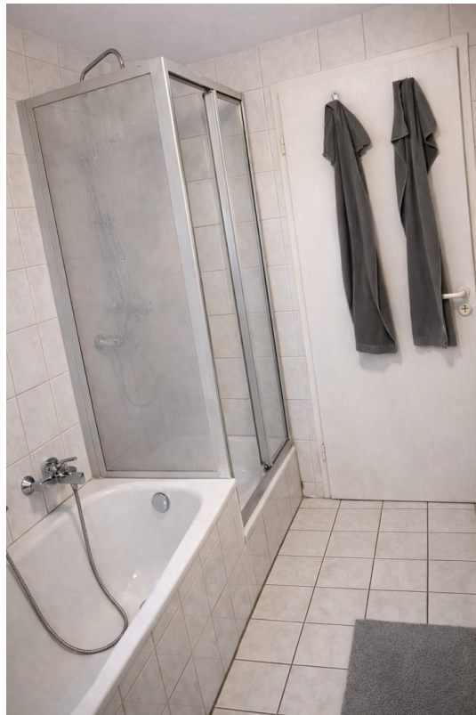
Dusche + Badewanne