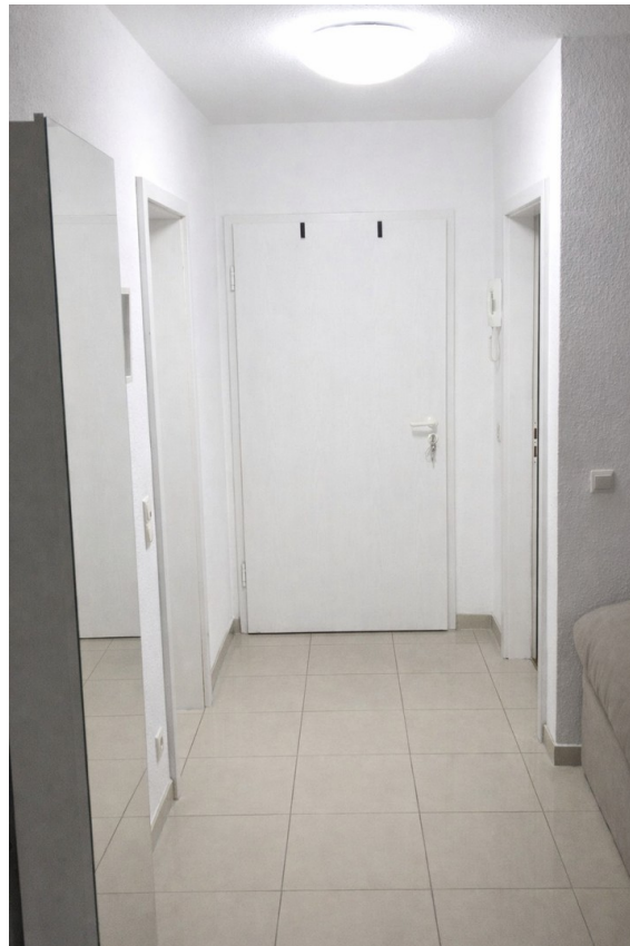
Flur mit Sicht zum Eingang