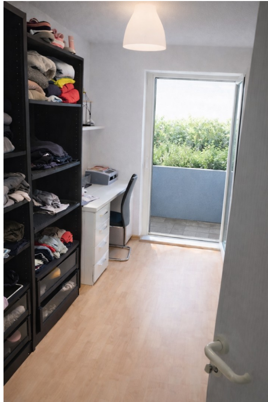
Büro / Schlafzimmer 2