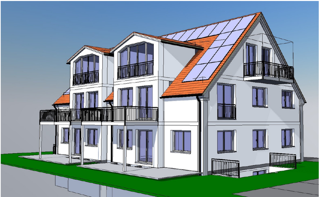
Erstellte Perspektiv des MFH