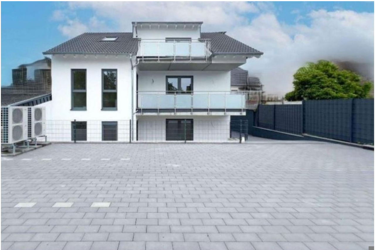
Rückseite der Anlage