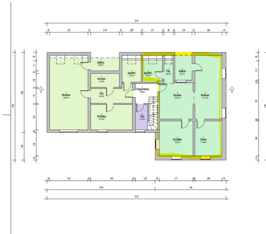
Grundriss der Wohnung (gelb um