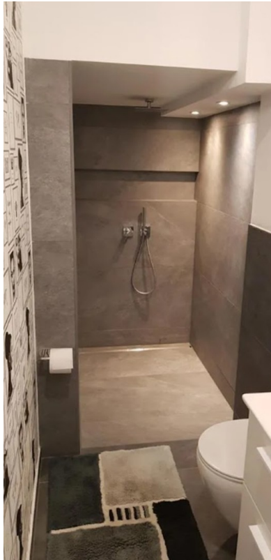
Bad & WC