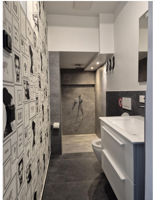
Bad mit WC