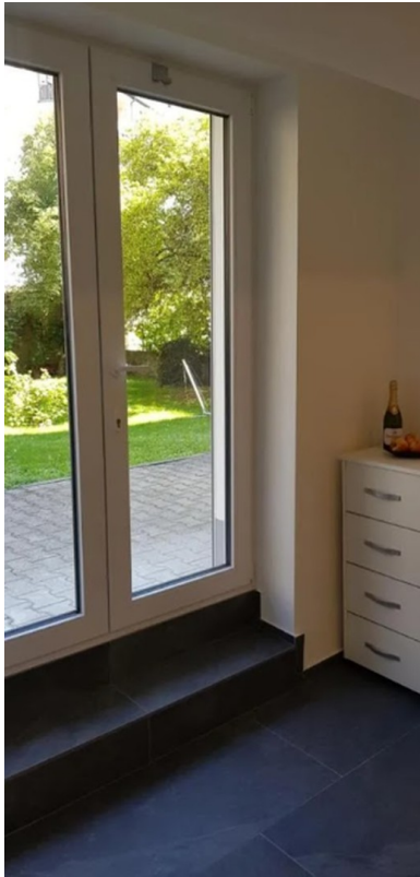
Ausgang zur Terrasse