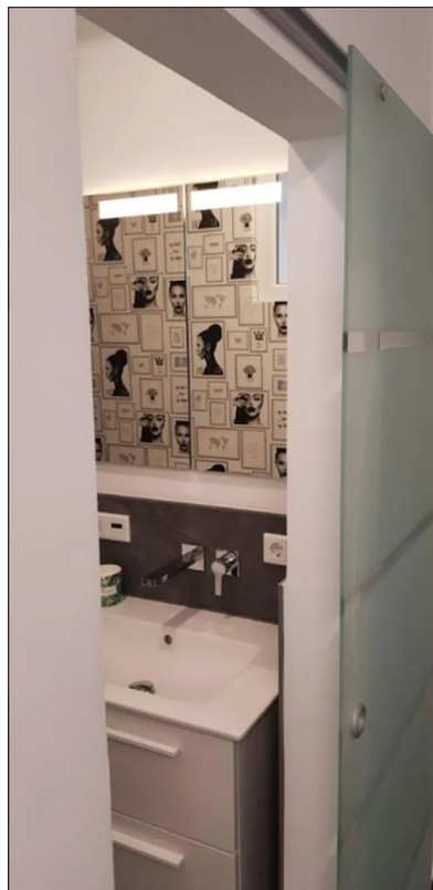
Eingang zum Bad