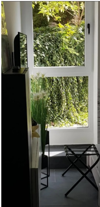
Fenster zum GArten