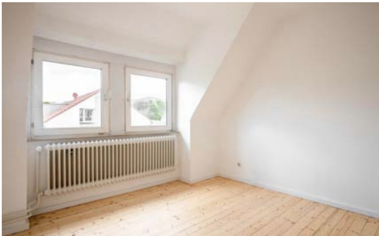
Büro / Kinderzimmer Ansicht 1