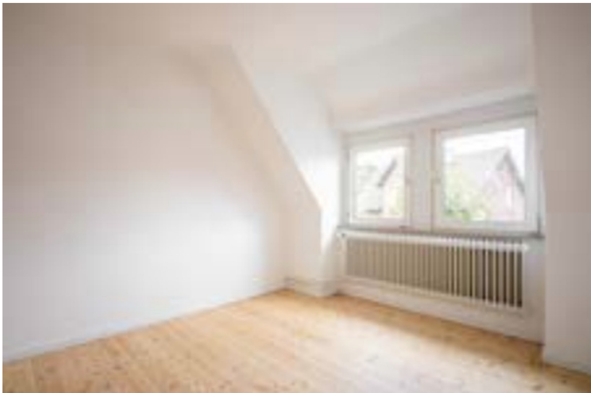
Büro / Kinderzimmer Ansicht 2