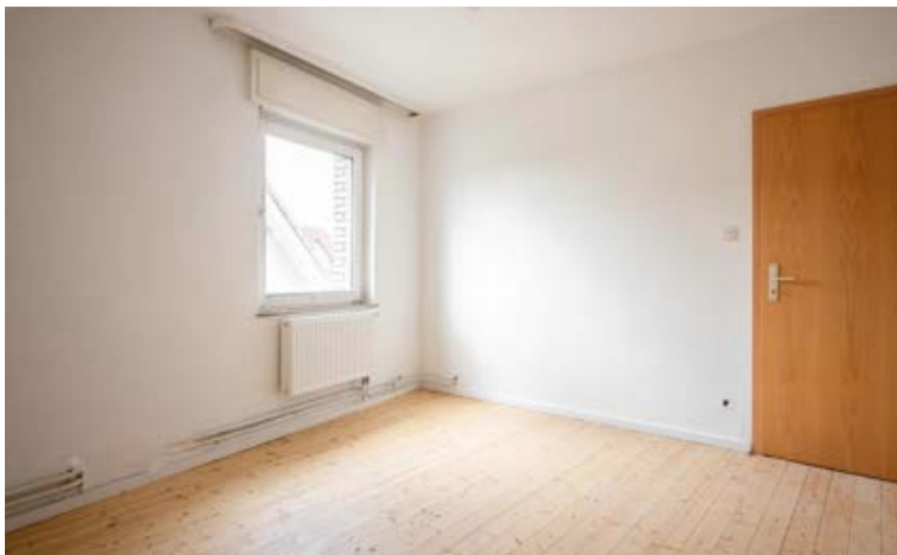
Schlafzimmer Ansicht 1