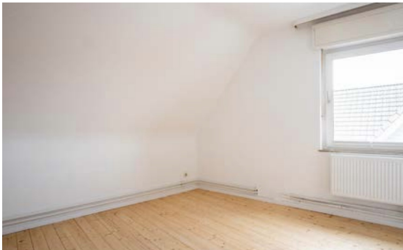
Schlafzimmer Ansicht 2