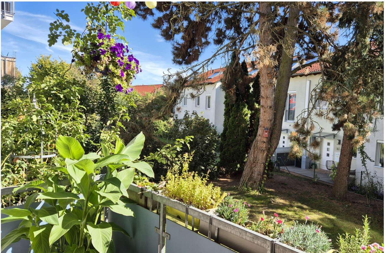
Hauptbalkon mit Gartenblick