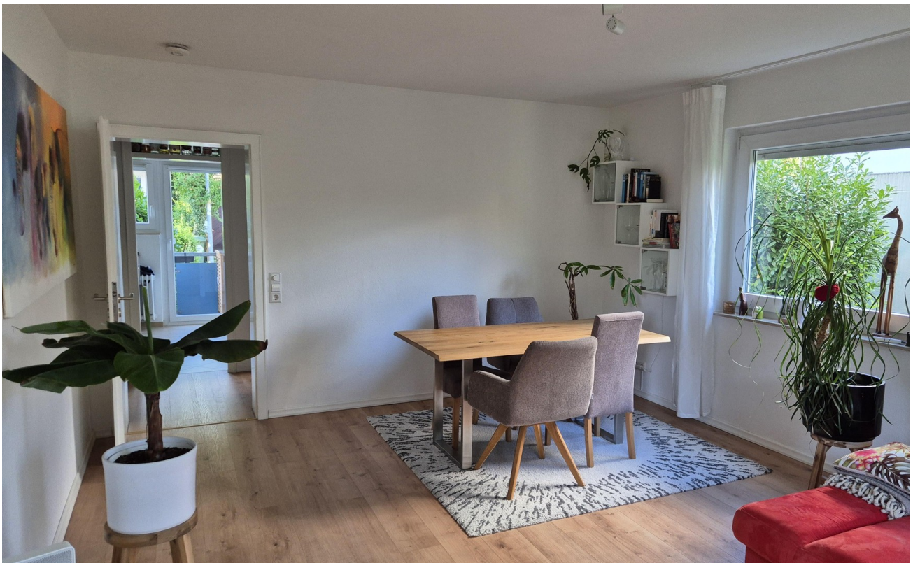
Wohnbereich mit Balkonzugang