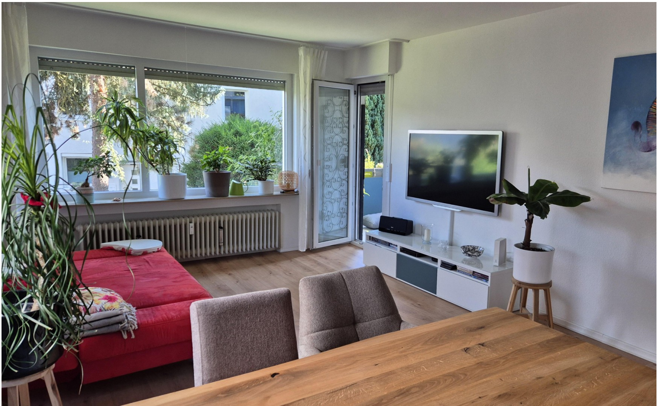
Wohnbereich mit Balkonzugang