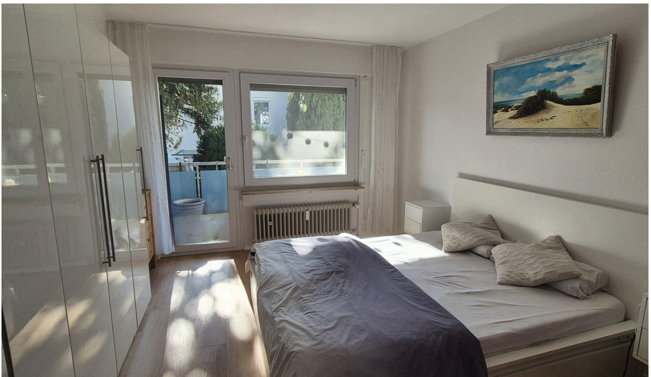
Schlafzimmer mit Balkonzugang