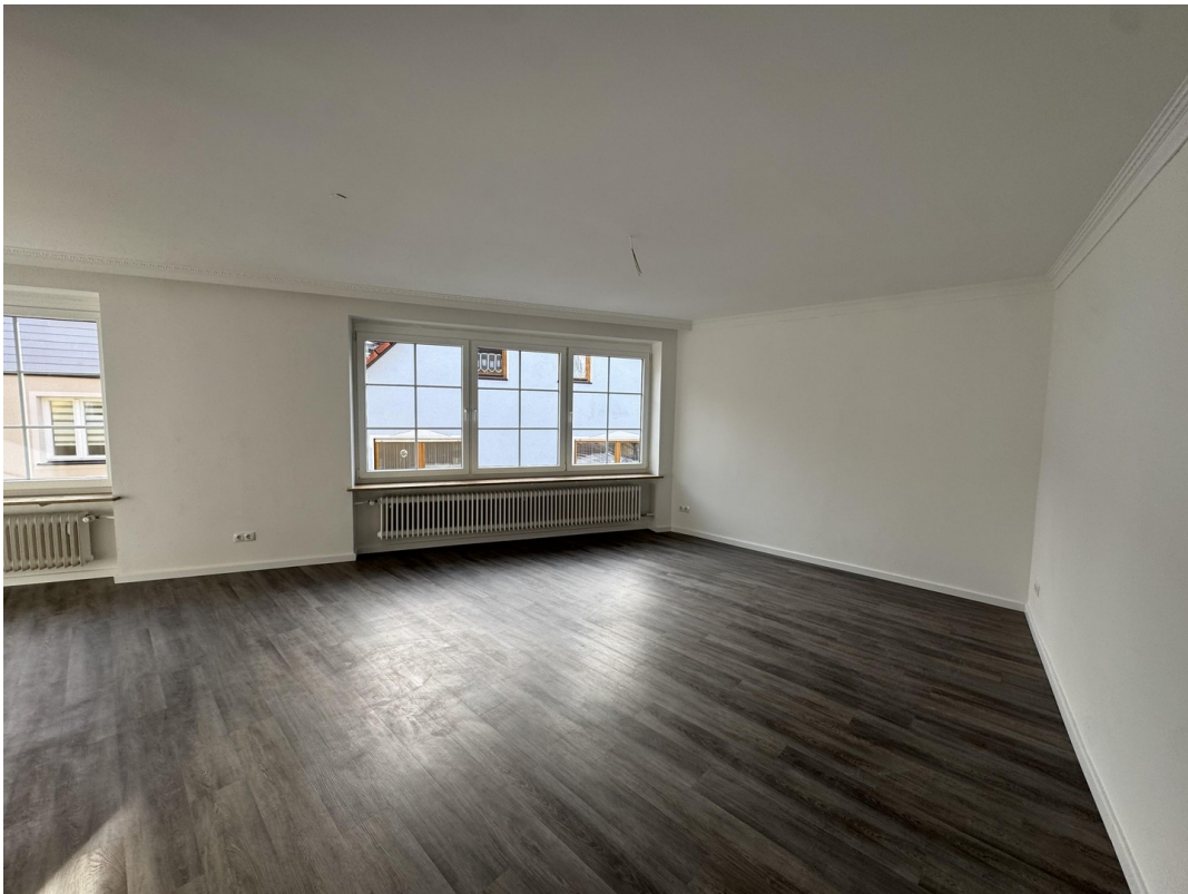
Wohnen & Essen