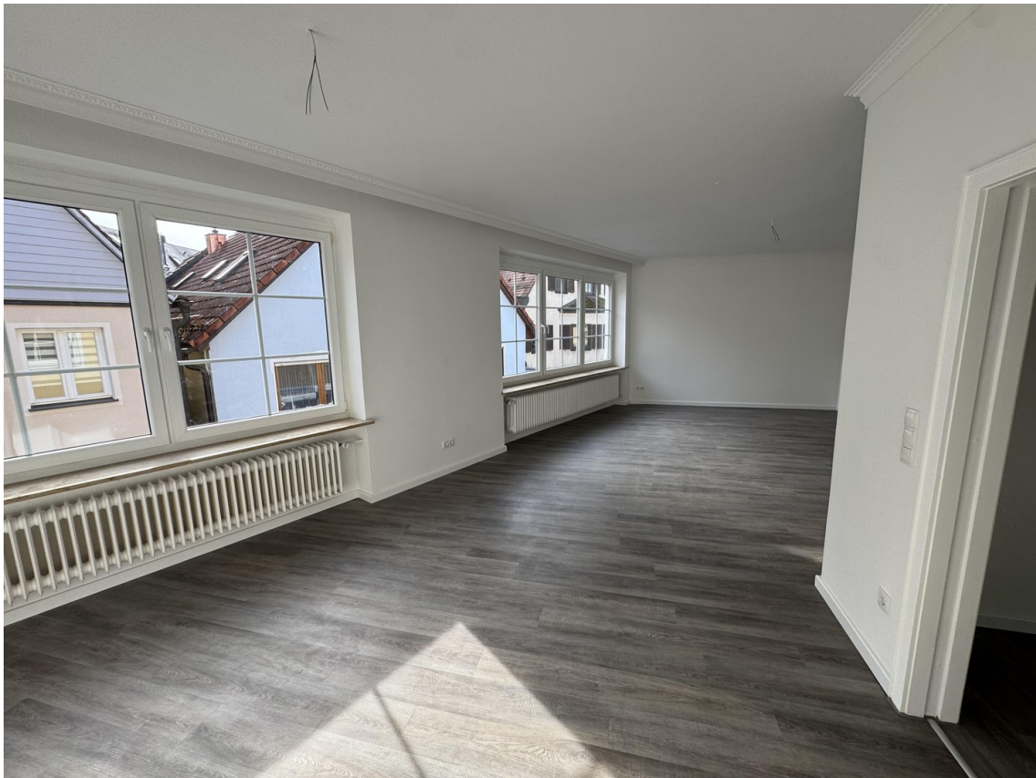
Wohnen & Essen