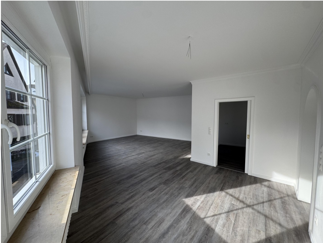
Wohnen & Essen