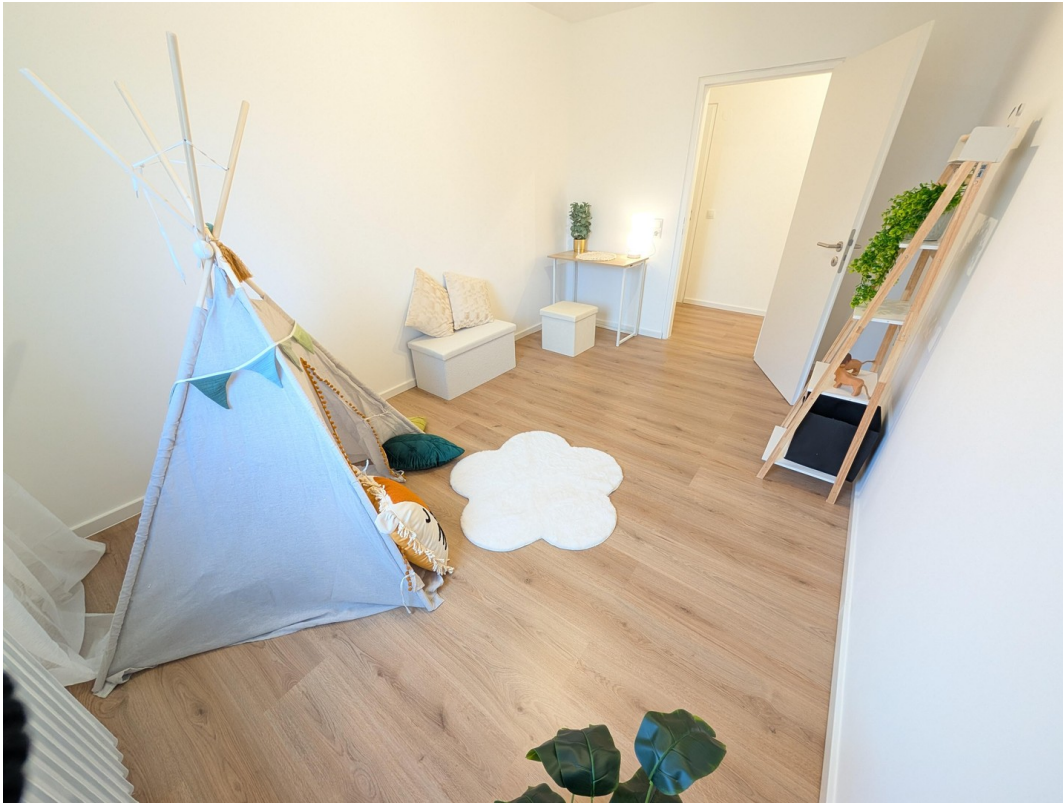
Kinder- / Arbeitszimmer