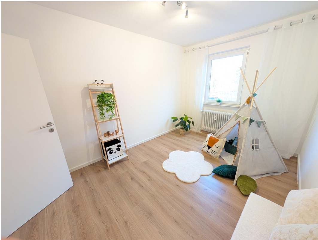
Kinder- / Arbeitszimmer