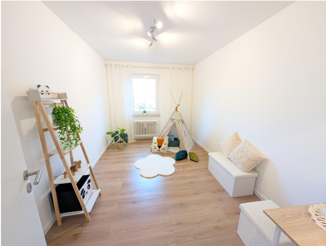
Kinder- / Arbeitszimmer