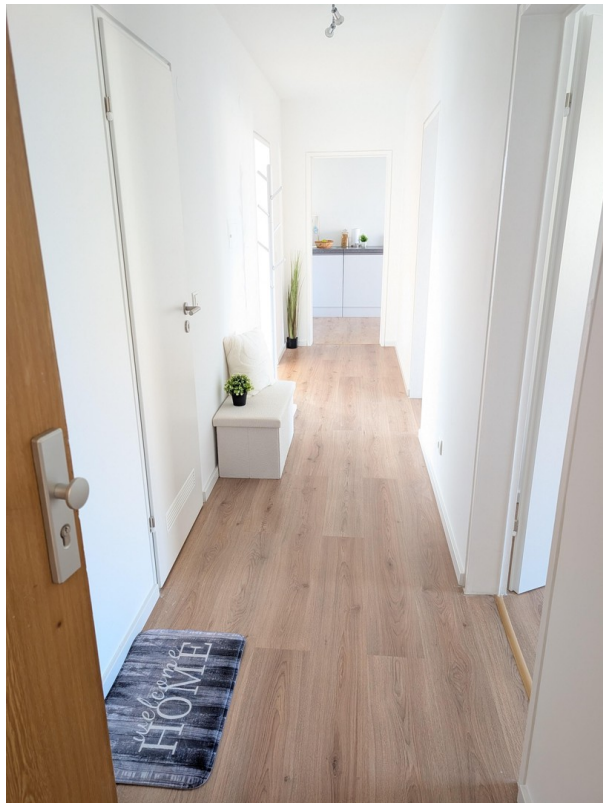
Eingangsbereich / Flur