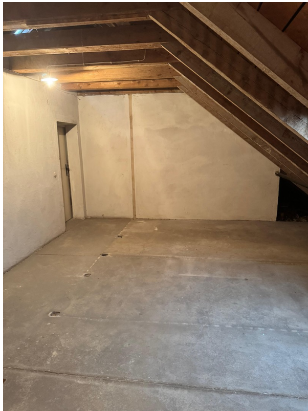
Dachboden Aufnahme 4