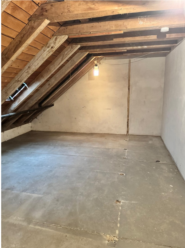
Dachboden Aufnahme 5