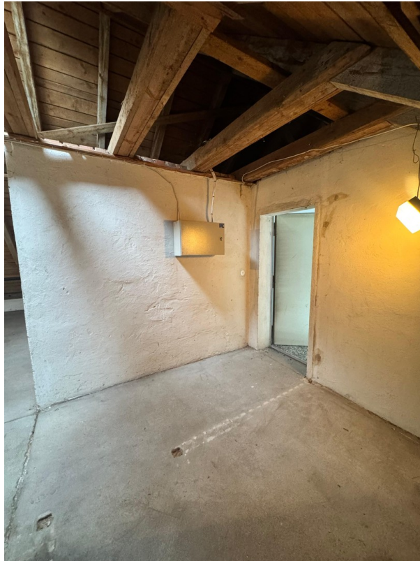
Dachboden Aufnahme 3