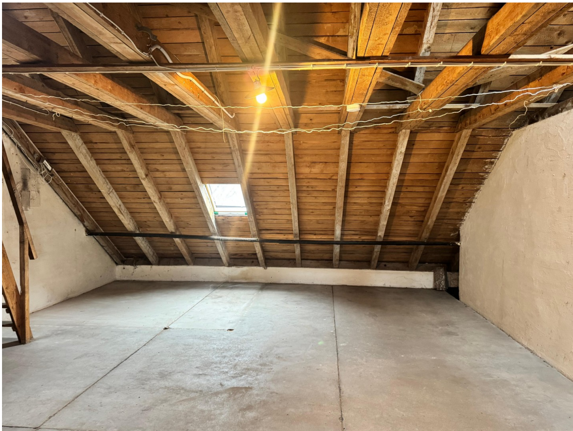
Dachboden Aufnahme 2