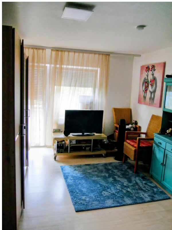
Kinderzimmer 2 OG Balkon