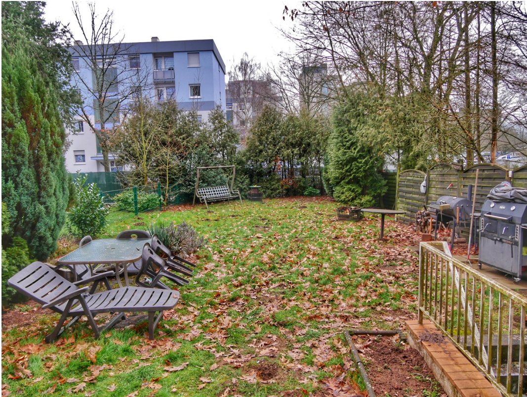
Blick in den Garten (Herbst)