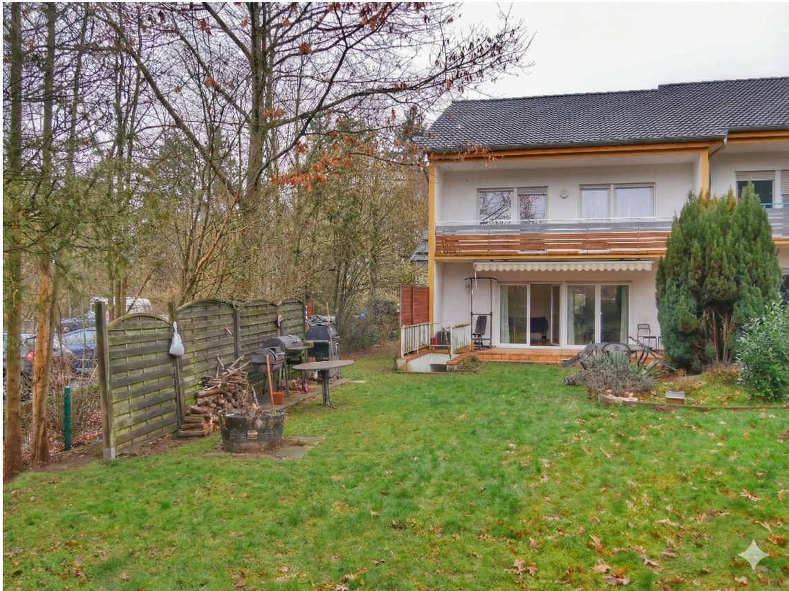
Blick auf das Haus