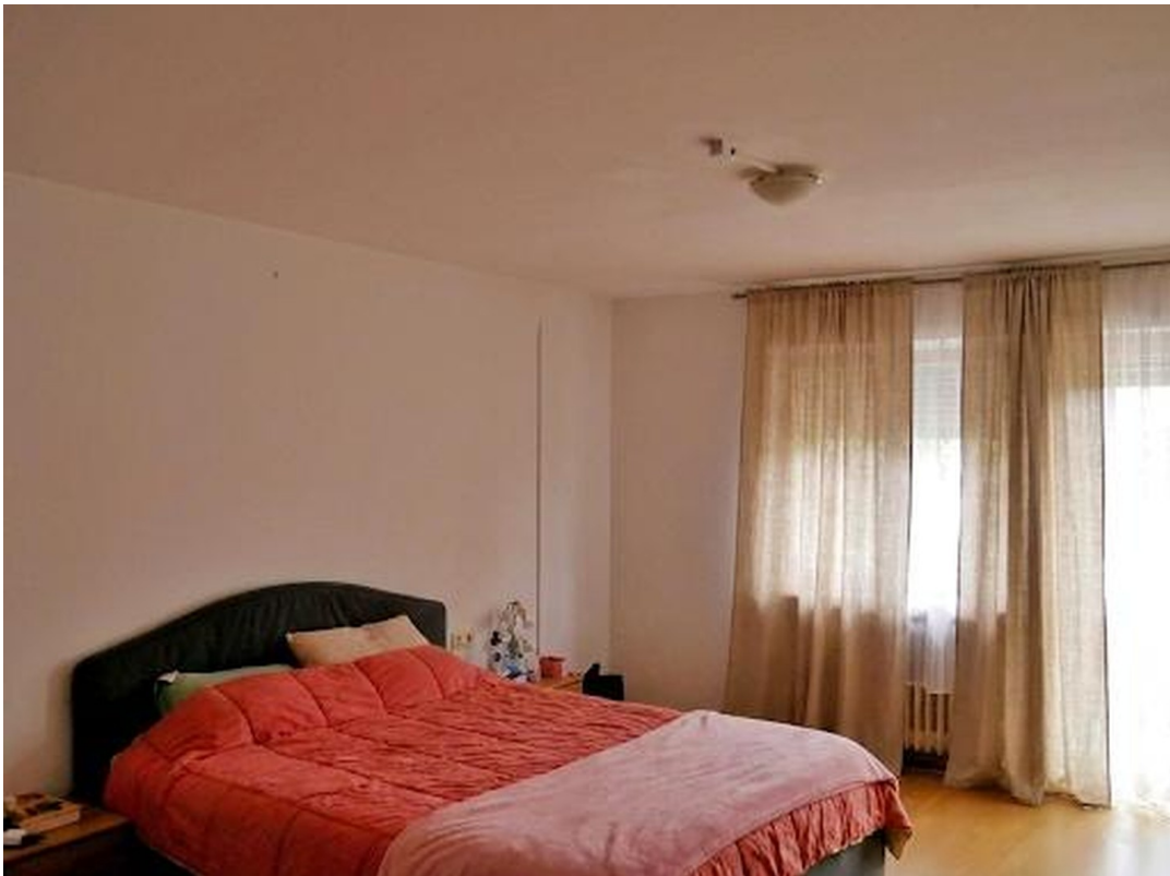
Schlafzimmer am Balkon