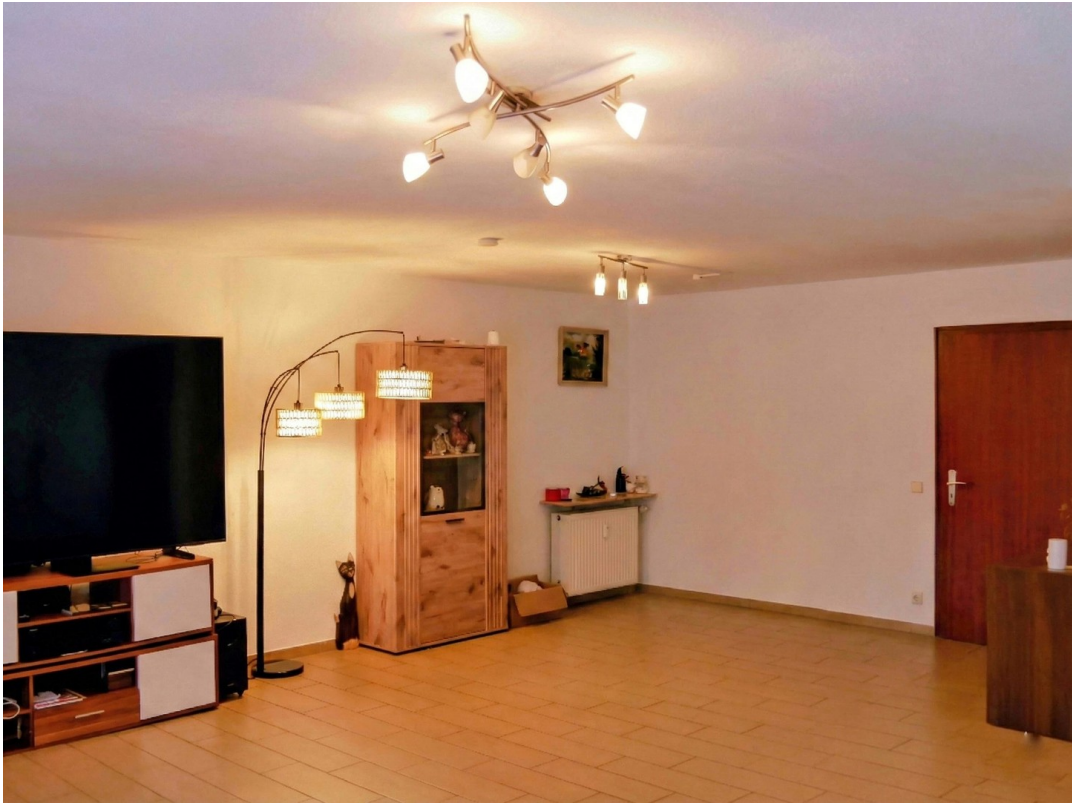
Wohnzimmer, Blick zur Küche