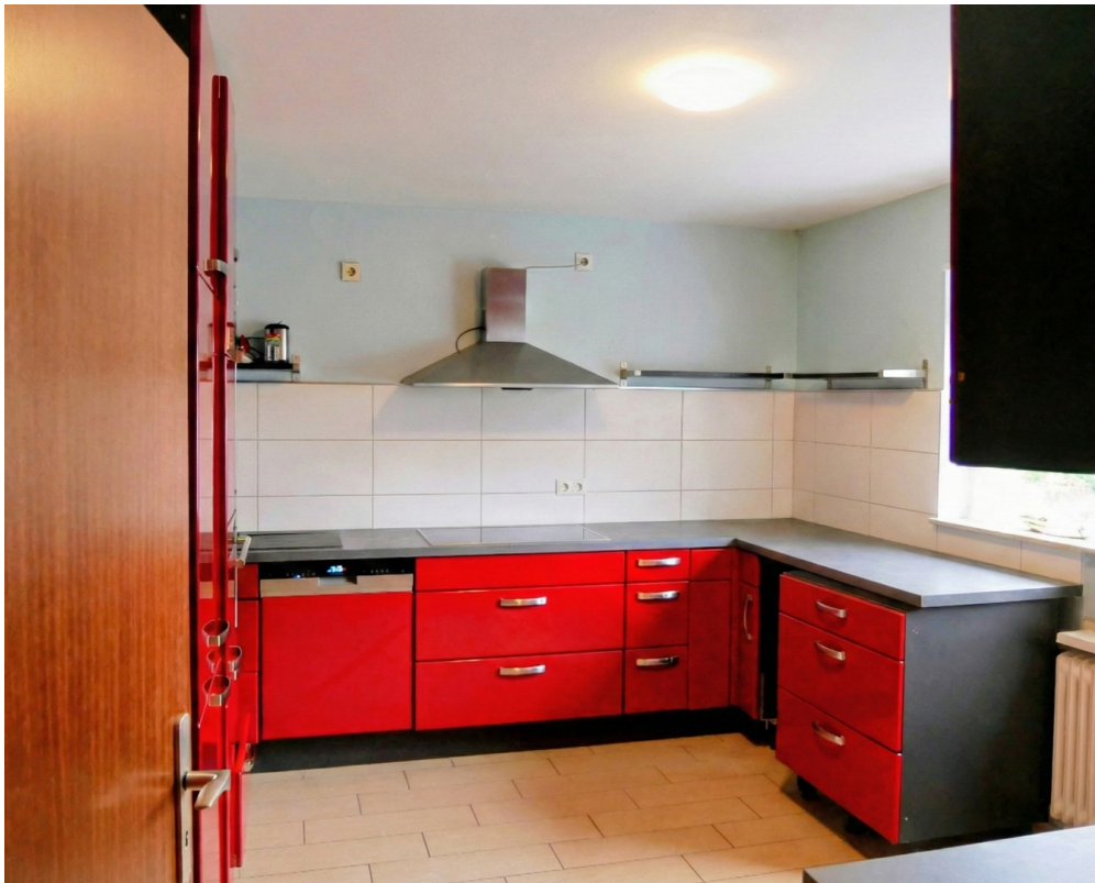
Küche (Abkauf möglich)