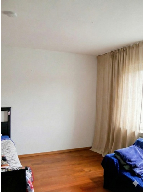
Kinderzimmer im OG