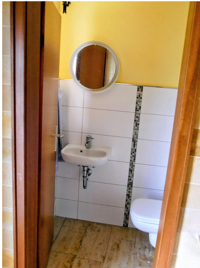
Gäste WC am Eingang