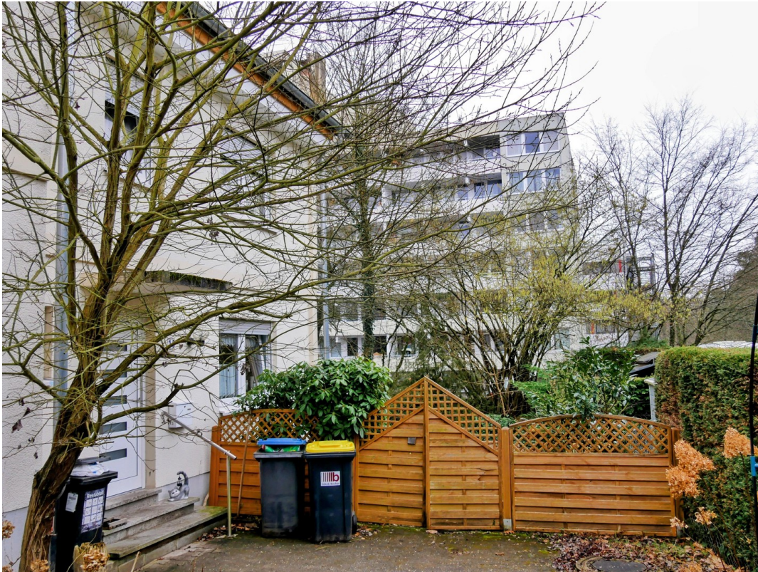
Haus-Front mit Gartentor