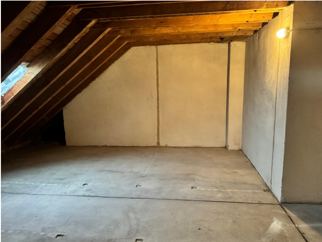
Dachboden Aufnahme 3