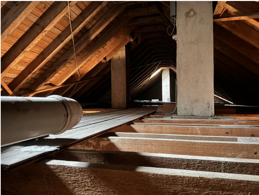
Dachboden Aufnahme 4