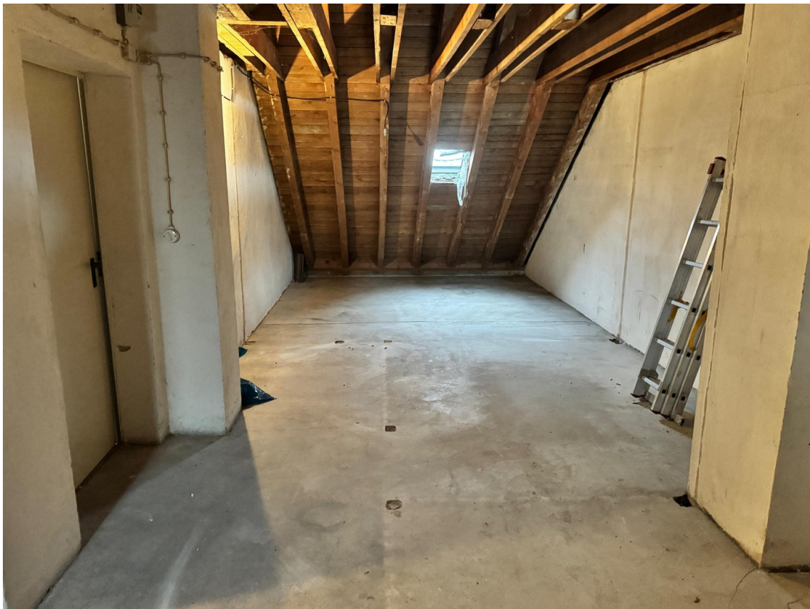
Dachboden Aufnahme 2