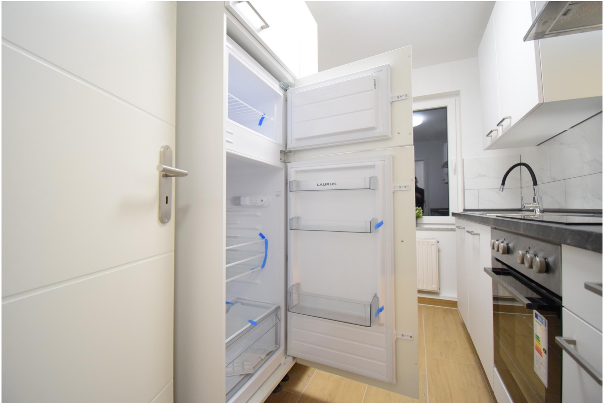
neue Küche ( Nobilia )