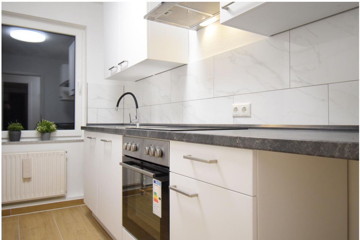
neue Küche ( Nobilia )