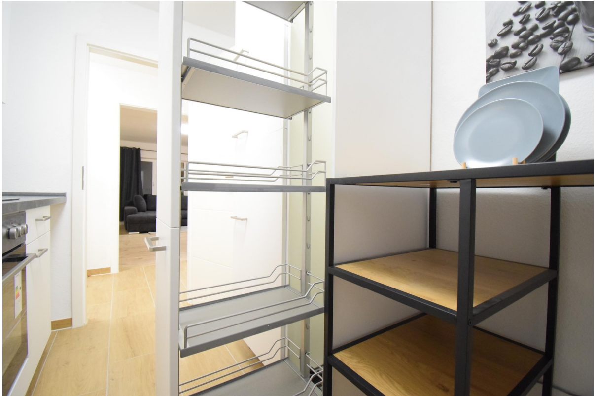
neue Küche ( Nobilia )