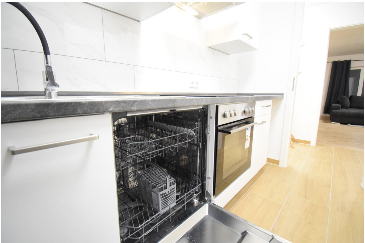
neue Küche (Spülmaschine)