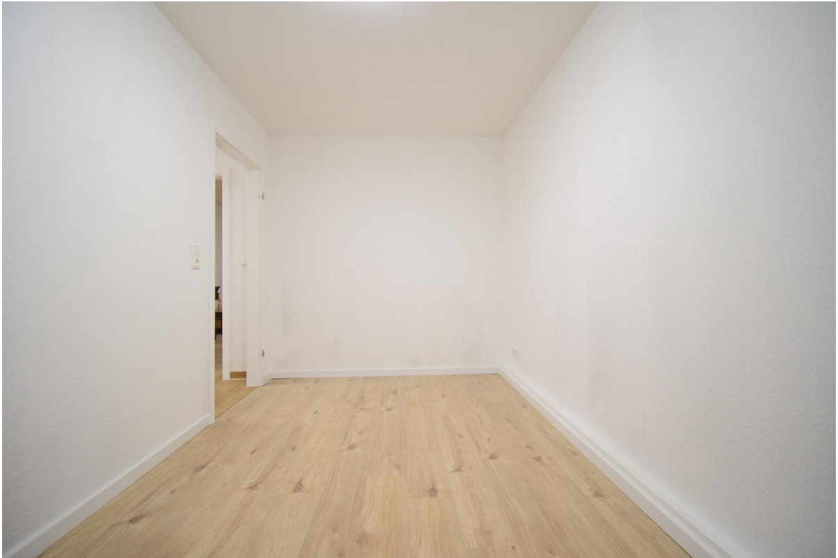
Office / Kinderzimmer