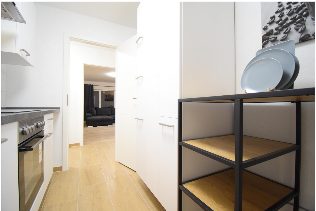
neue Küche ( Nobilia )