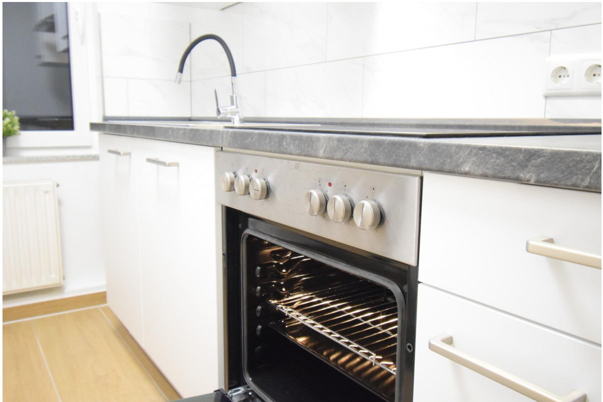
neue Küche (Backofen)