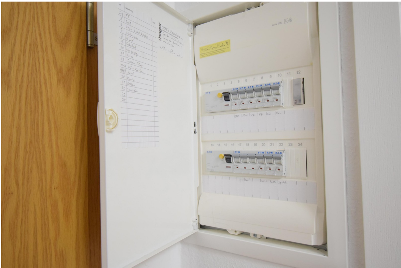
neue Elektrik (2025)