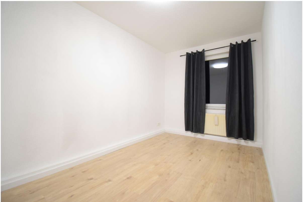
Office / Kinderzimmer