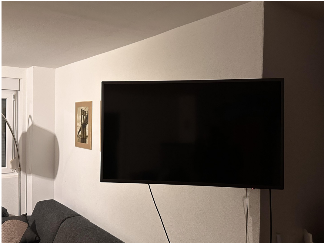
Teilw. incl. Samsung Smart TV