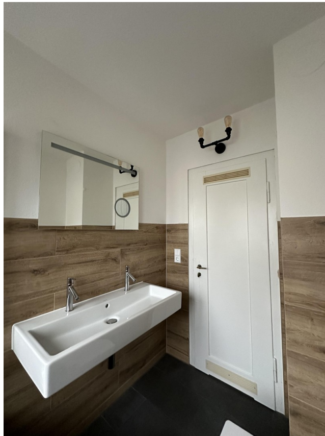
S- Bad Cannstatt