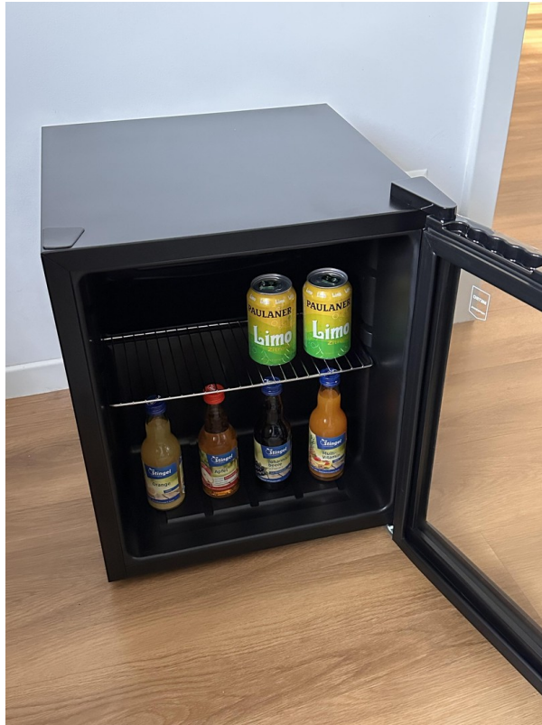
Teilw. incl. Minibar im Zimmer