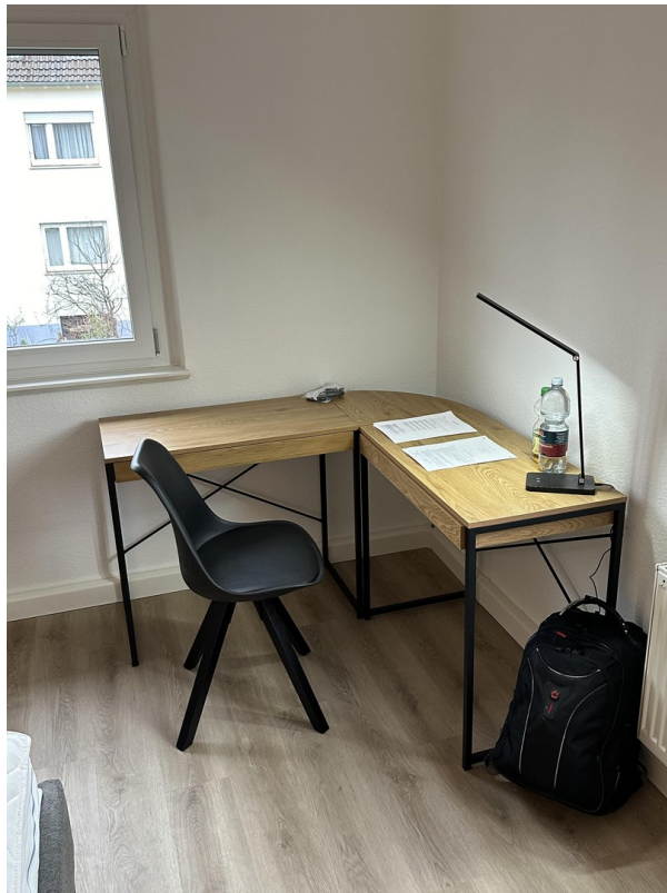
S- Bad Cannstatt