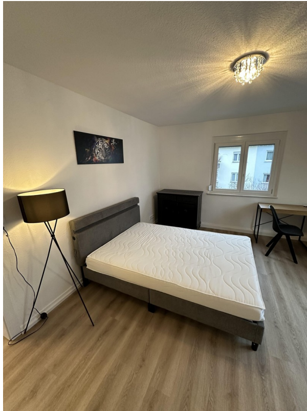
S- Bad Cannstatt