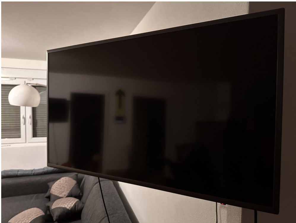
Teilw. incl. Samsung Smart TV