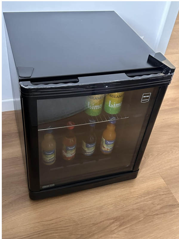
Teilw. incl. Minibar im Zimmer