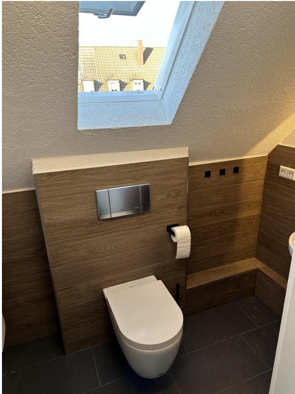
S- Bad Cannstatt