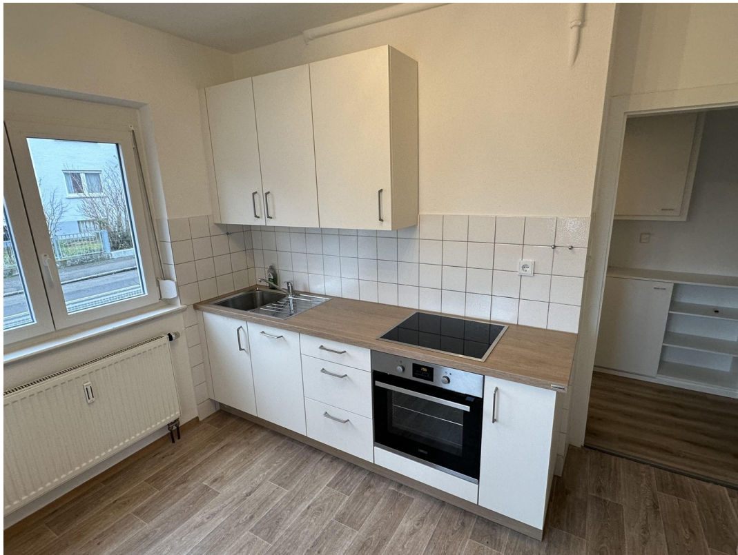
S- Bad Cannstatt