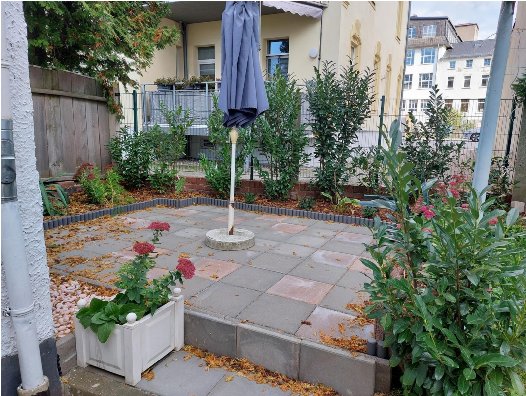
Terrasse m. Grillplatz im Hof