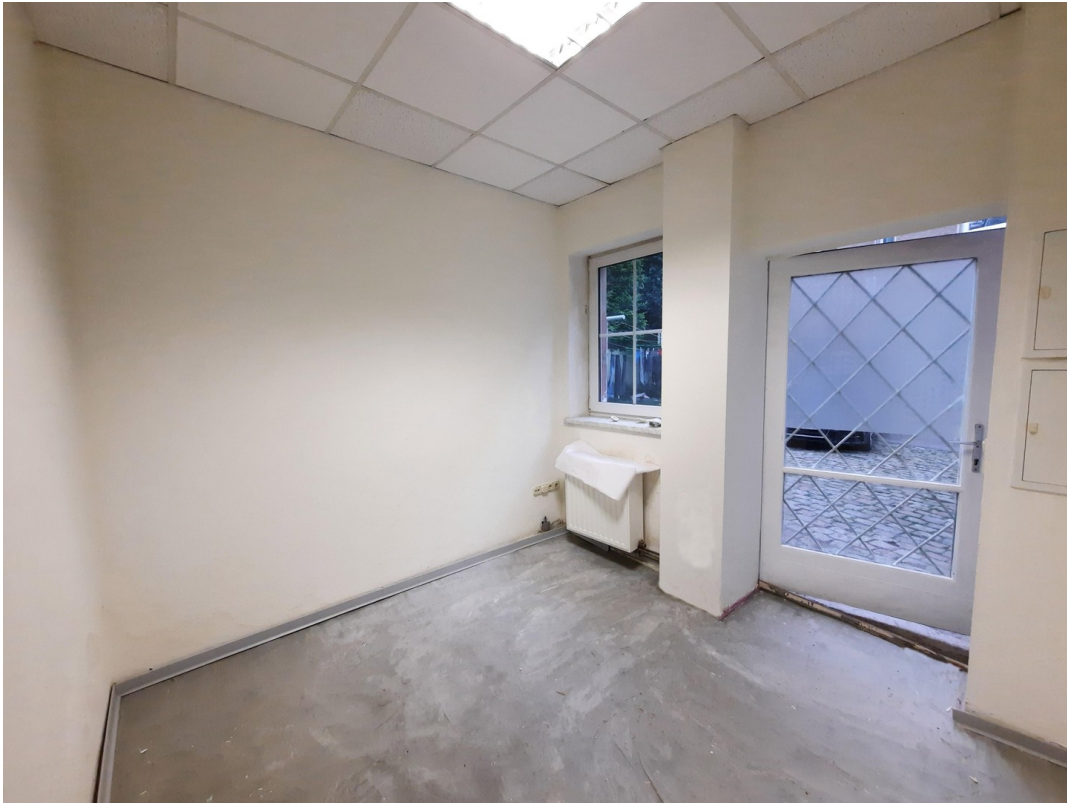
Hobby-Raum / Werkstatt