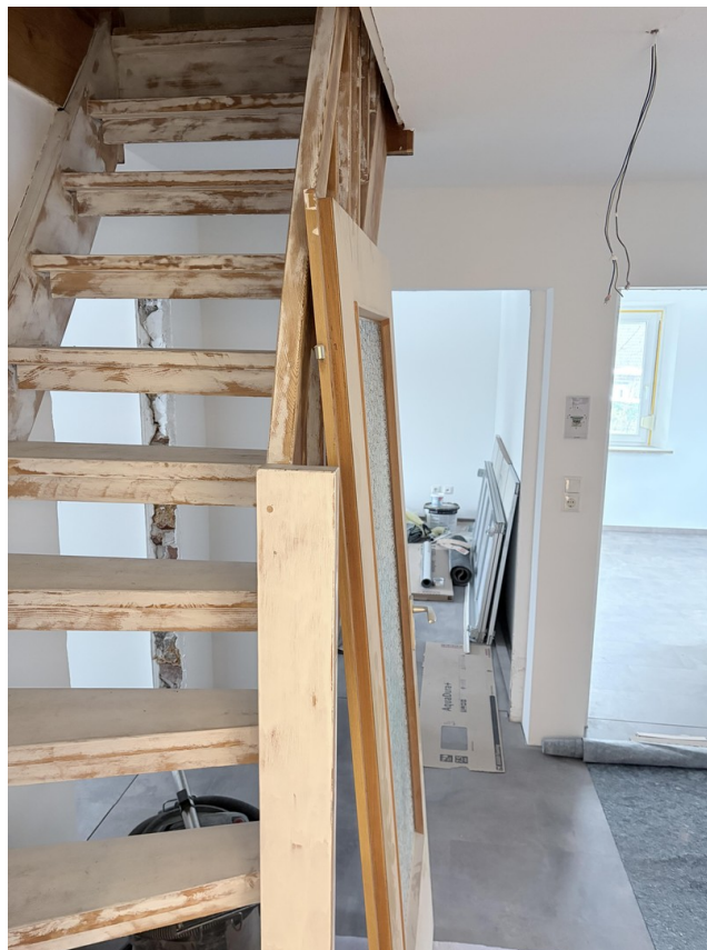
Treppe zum Dachgeschoss