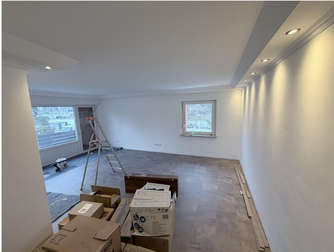
Wohnzimmer mit Zugang Balkon