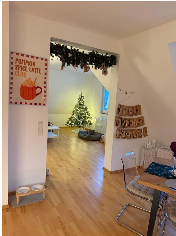
Blick Küche ins Wohnzimmer