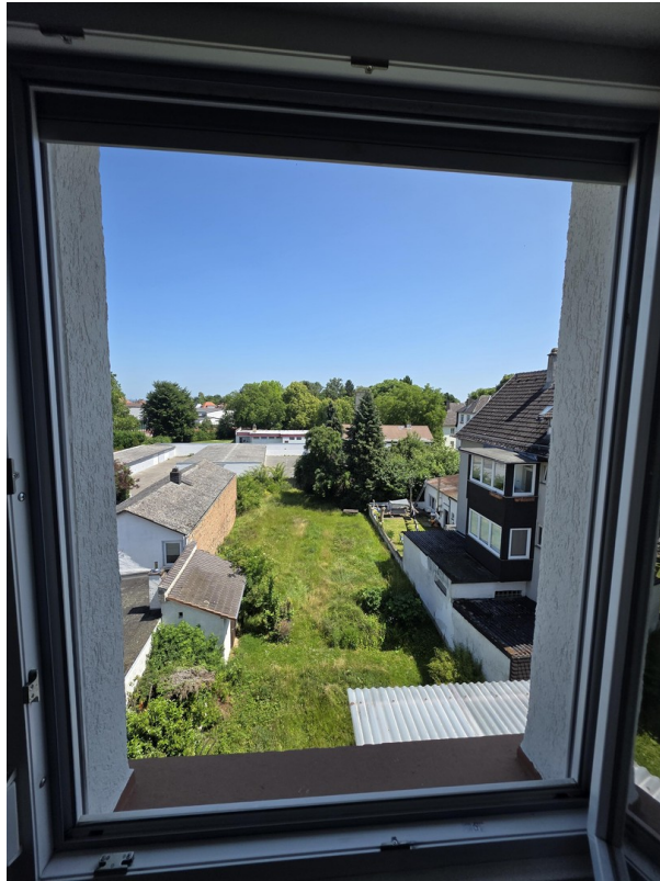
Blick aus dem Schlafzimmer