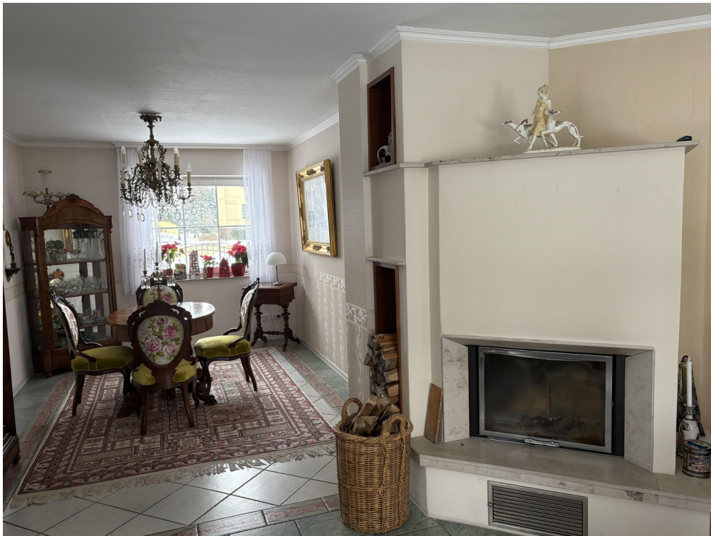
EG Wohnzimmer Straßenblick