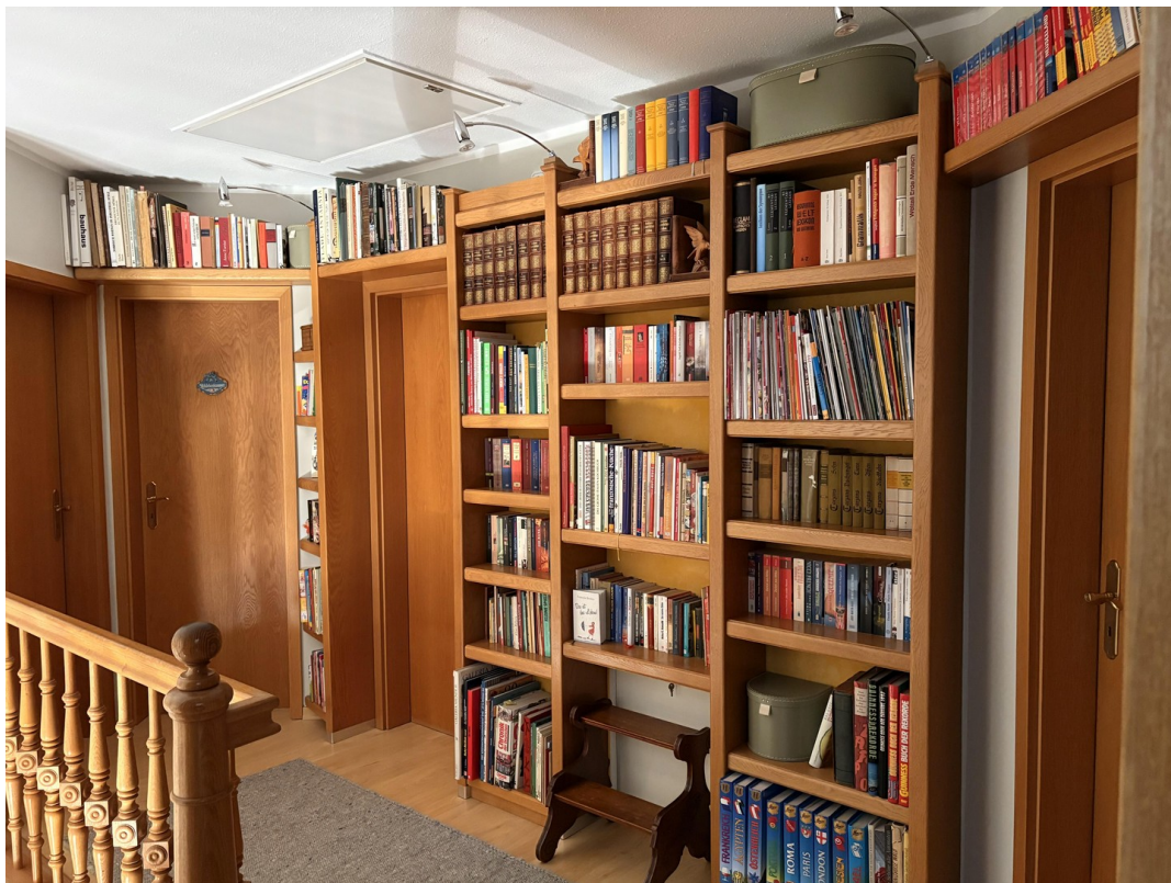
OG Flur, Galerie