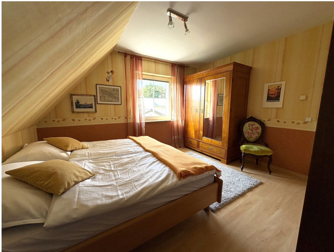
OG Schlaf- o. Gästezimmer