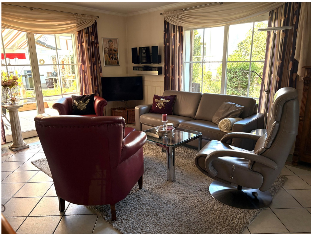
EG Wohnzimmer Gartenblick