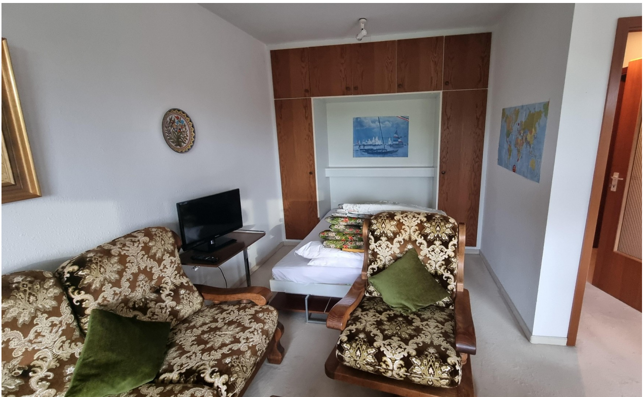
Wohnraum mit Schrankbett