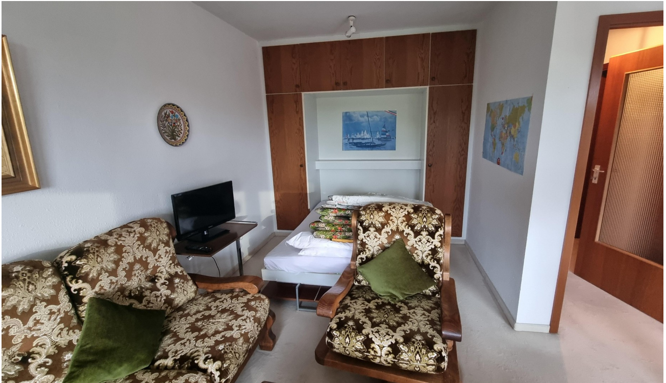
Wohnraum mit Schrankbett