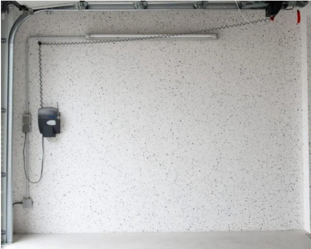
Licht und weitere Steckdosen