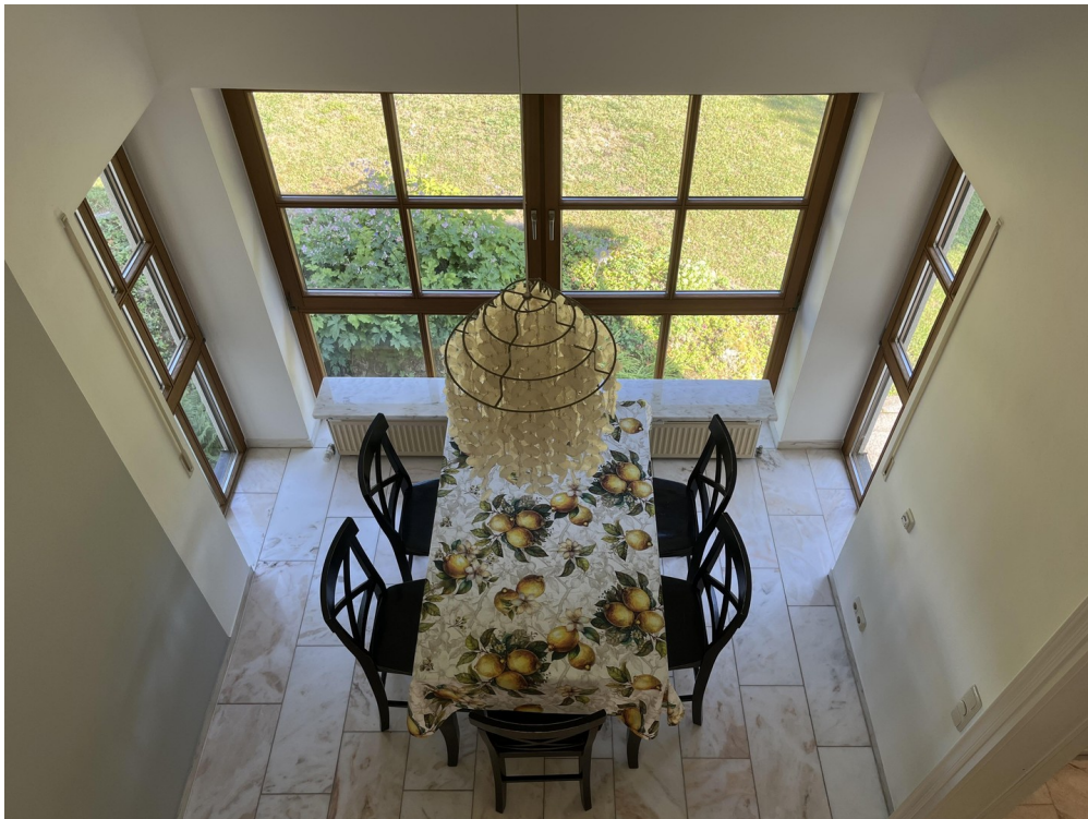
Blick von Galerie/Esszimmer