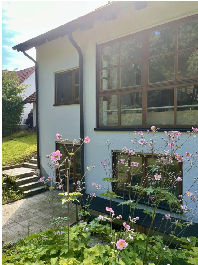
Rückansicht des Hauses