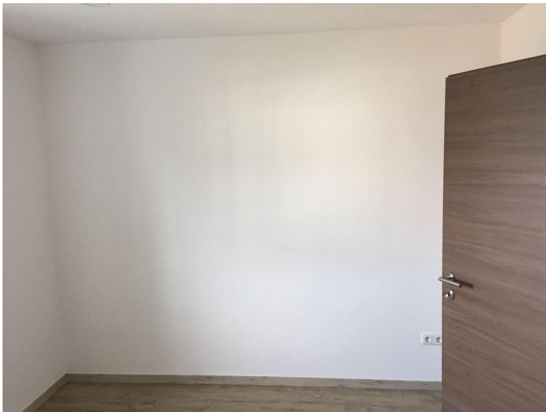
Wohnen / Essen / Kochen 2