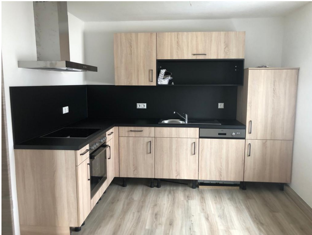
Wohnen / Essen / Kochen 1