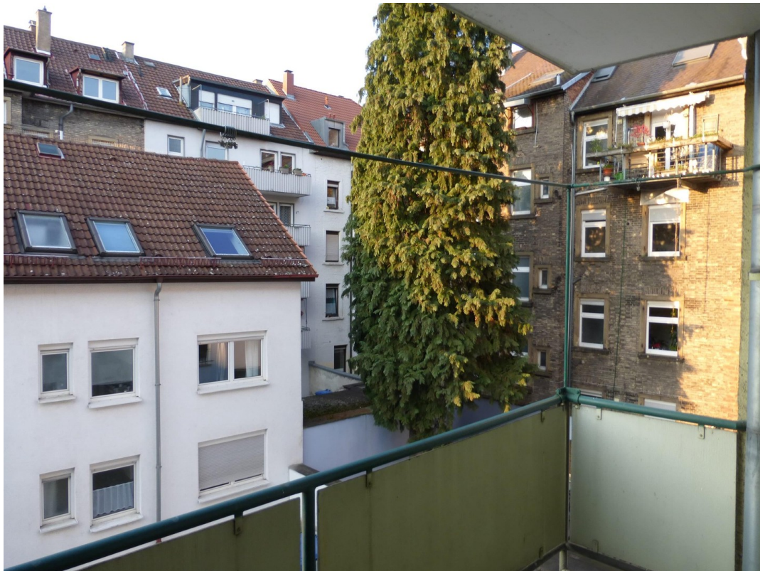
Balkon zum Hof (Nord-West)