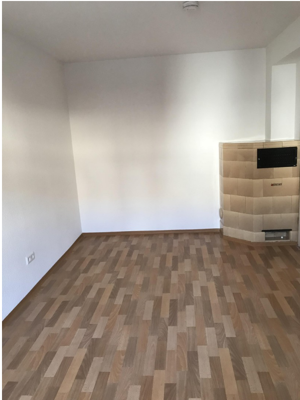
ehem. Ofen (ohne Funktion!!)