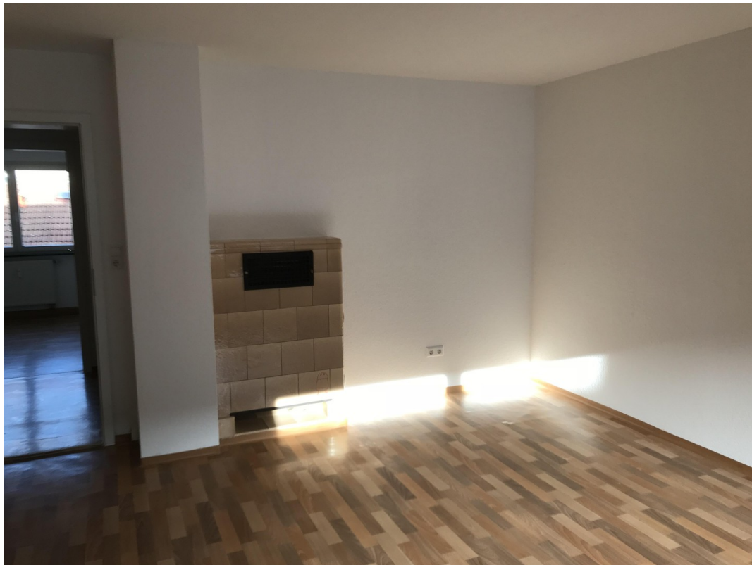
ehem. Ofen (ohne Funktion!!)