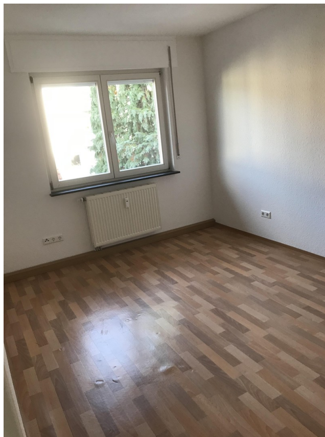
Das mittelgroße Zimmer zum Hof