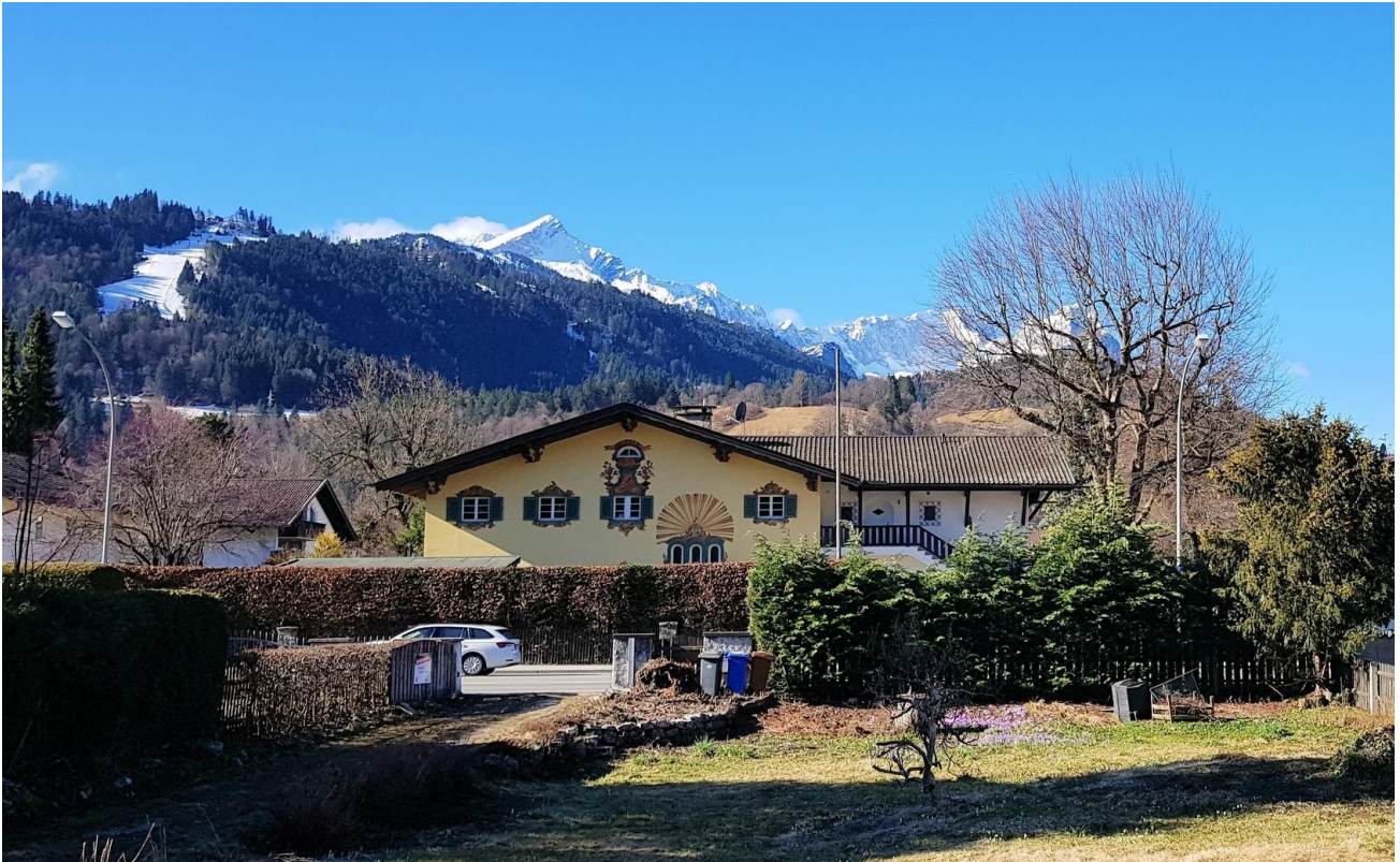
Aussicht SüdWest Alpspitze Zug