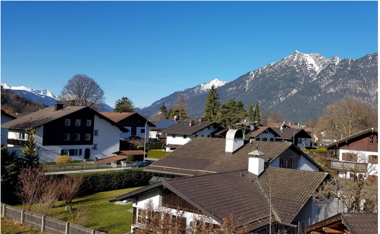
Aussicht NordWest Kramer