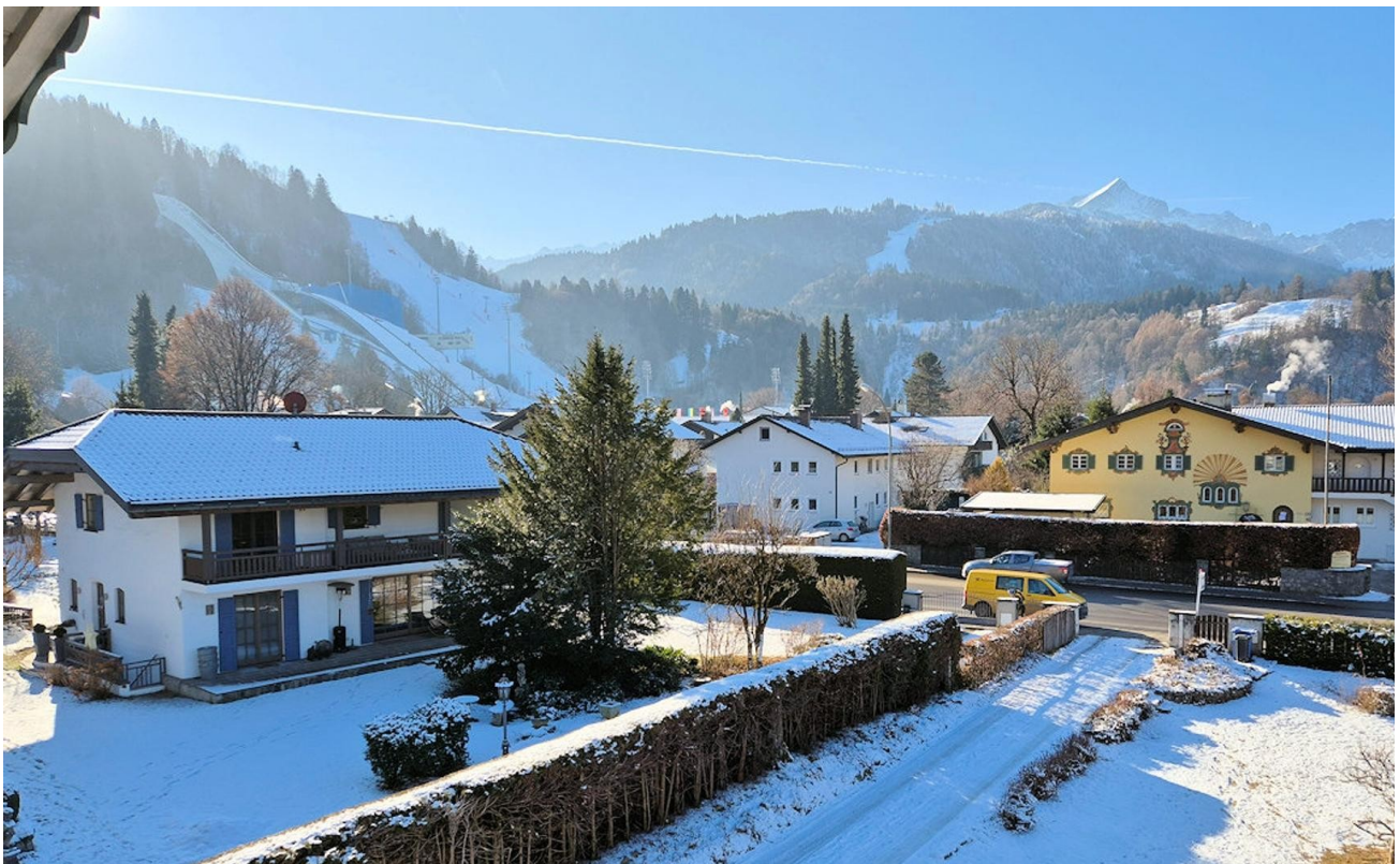
Aussicht Süd Alpspitze Schanze