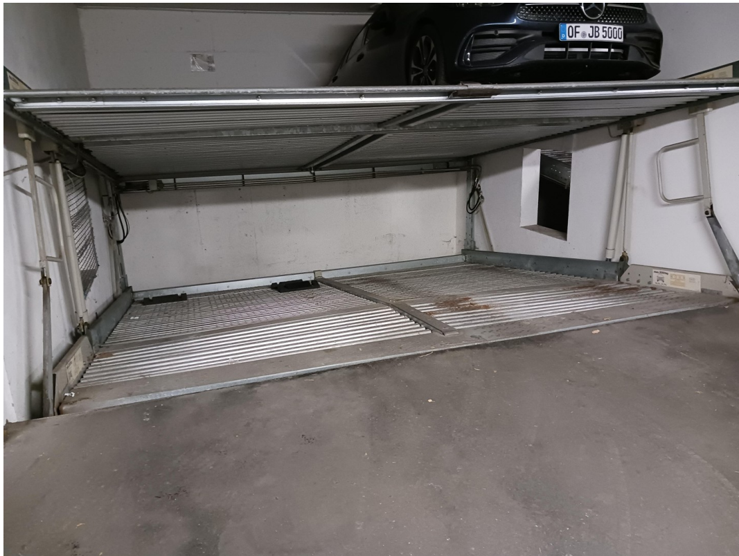
2 Pkw Stellplätze