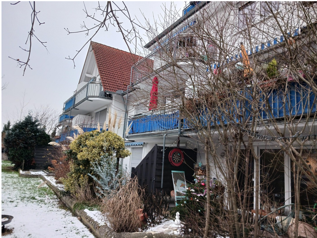
Hausansicht Gartenseite Süd