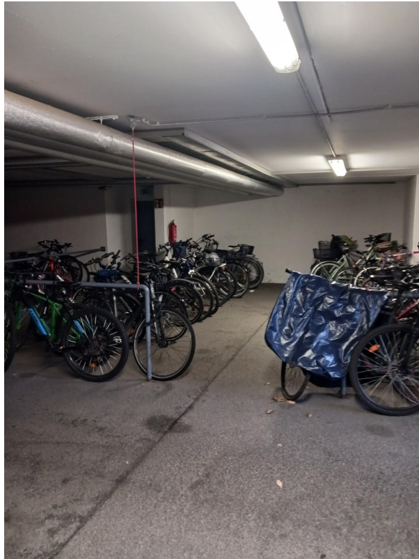
Tiefgarage Fahrrad Stellplätze