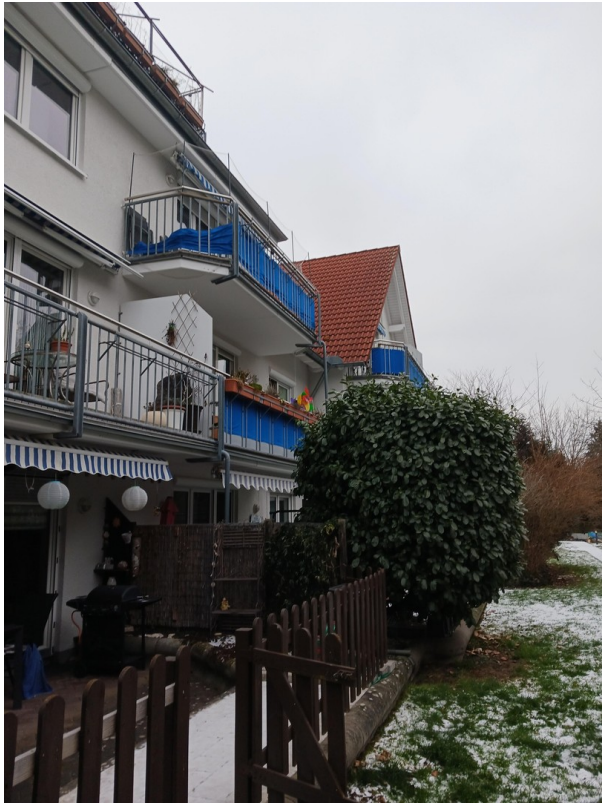
Hausansicht Garten Süd