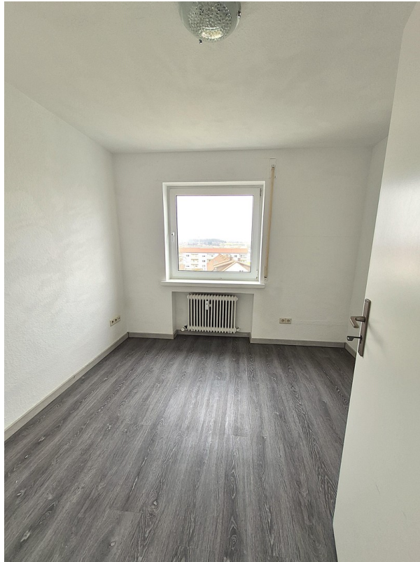
Kinderzimmer / Arbeitszimmer