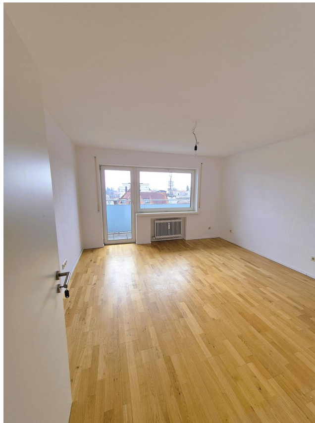
Schlafzimmer mit Balkon