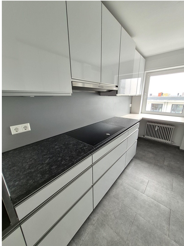
Herd in Küche