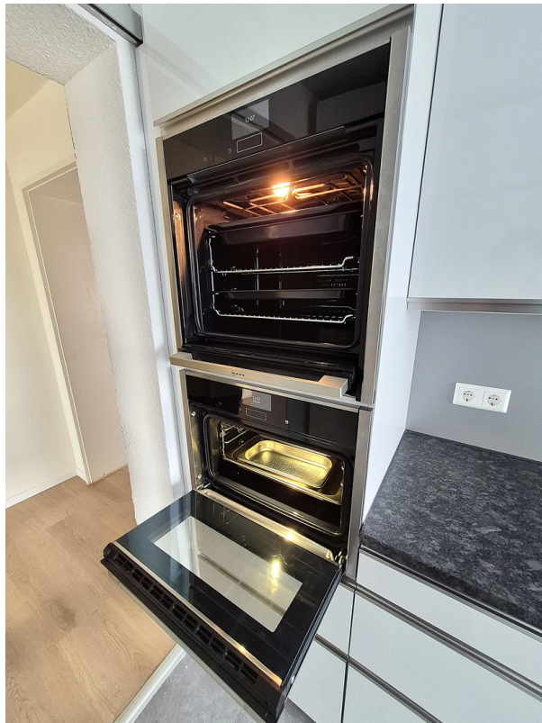
Backofen mit Grill in Küche