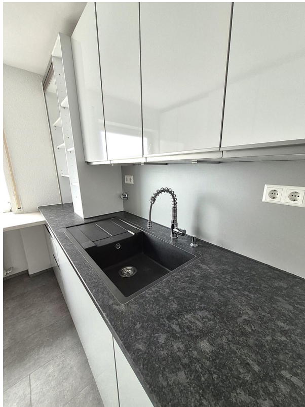
Spüle in Küche