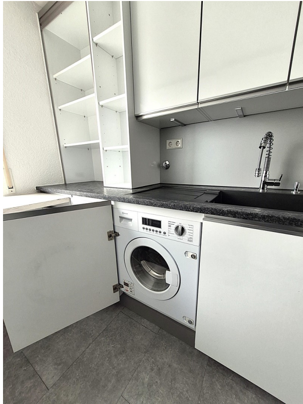
Waschmaschine in Küche