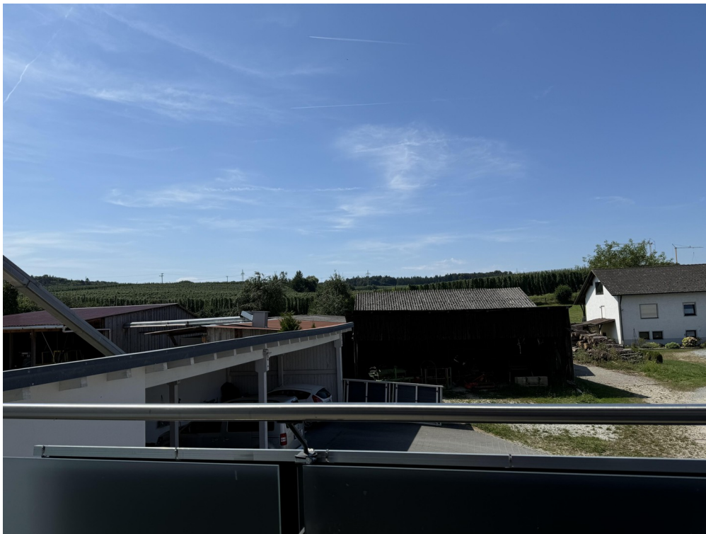
Aussicht vom Balkon