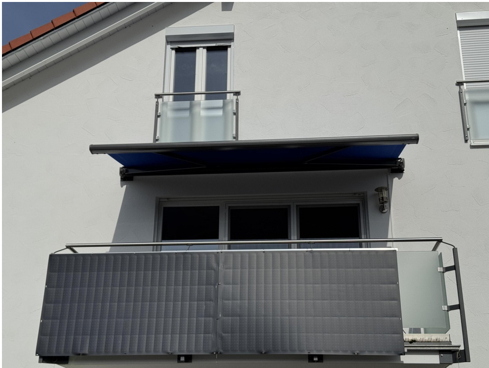
Balkon mit Markise