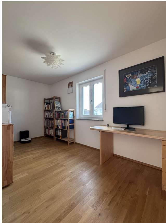
Kinderzimmer 2/ Büro