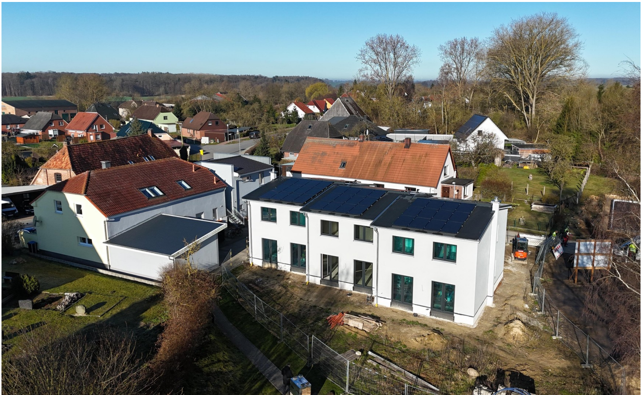
Neubau Gartenansicht 3