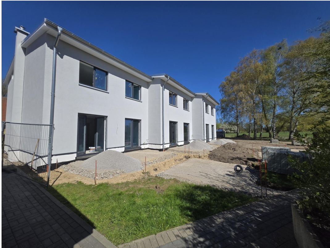
Neubau Gartenansicht 2