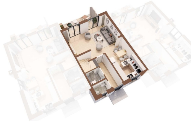
Grundriss EG 3D