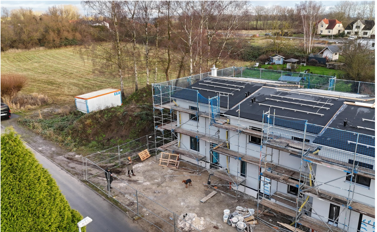
Neubau - Feldrand