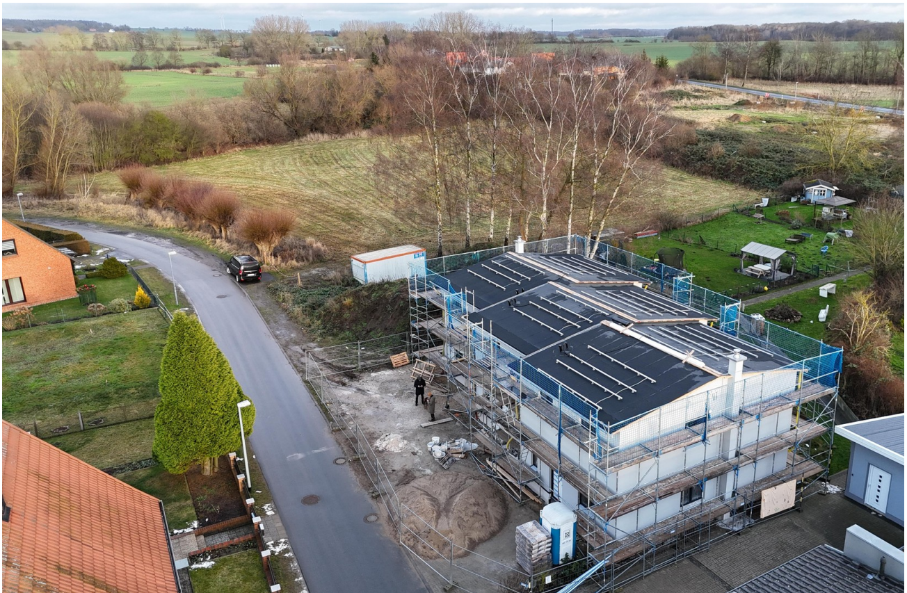
Neubau - Feldrand