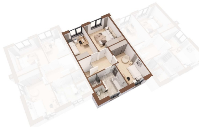
Grundriss OG 3D