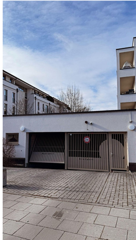
Einfahrt in die TG