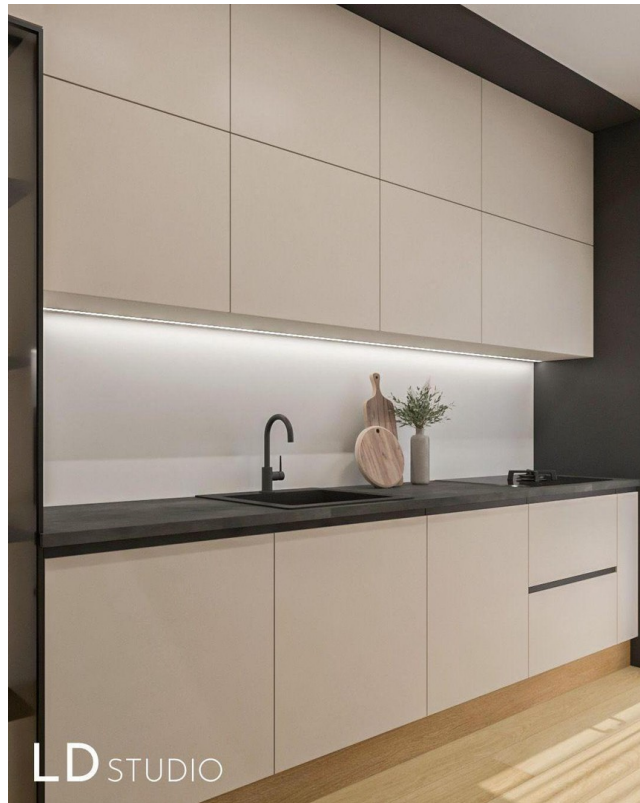
Küche 1 - Planung