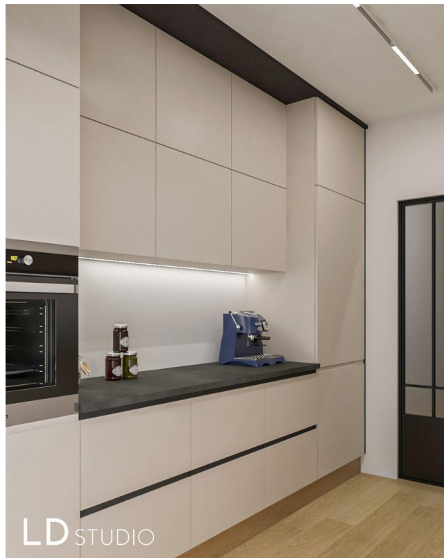
Küche 2 - Planung