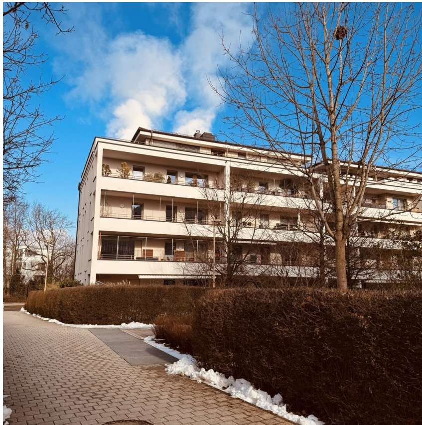
Sicht aus dem Süden