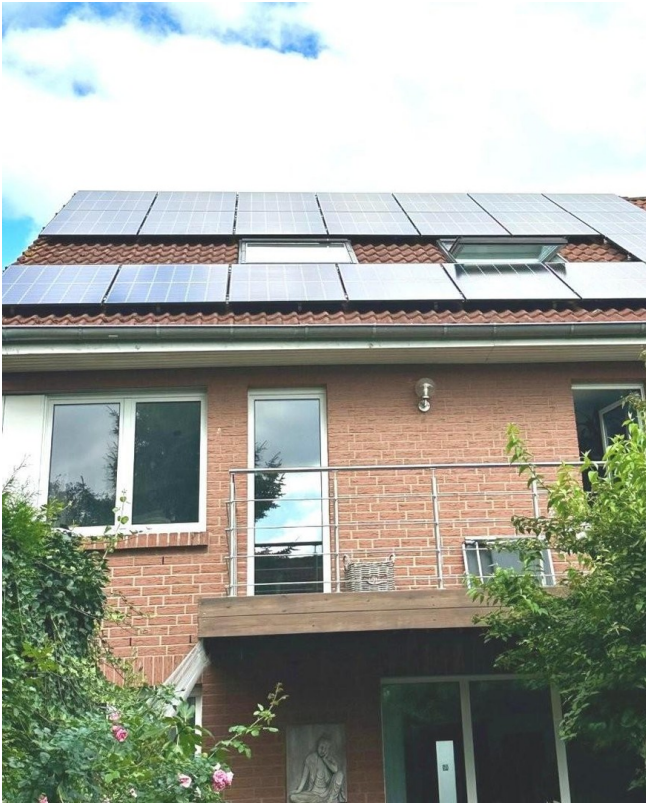
PV-Anlage mit Balkon