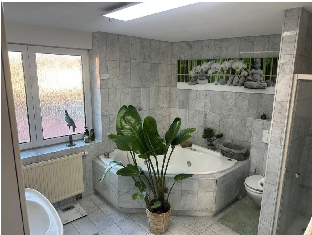
Masterbad 1. OG