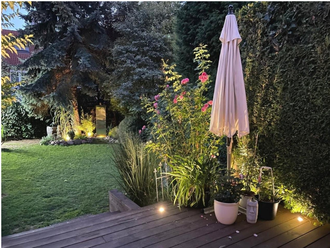
Garten mit Gardena-Bewässerung