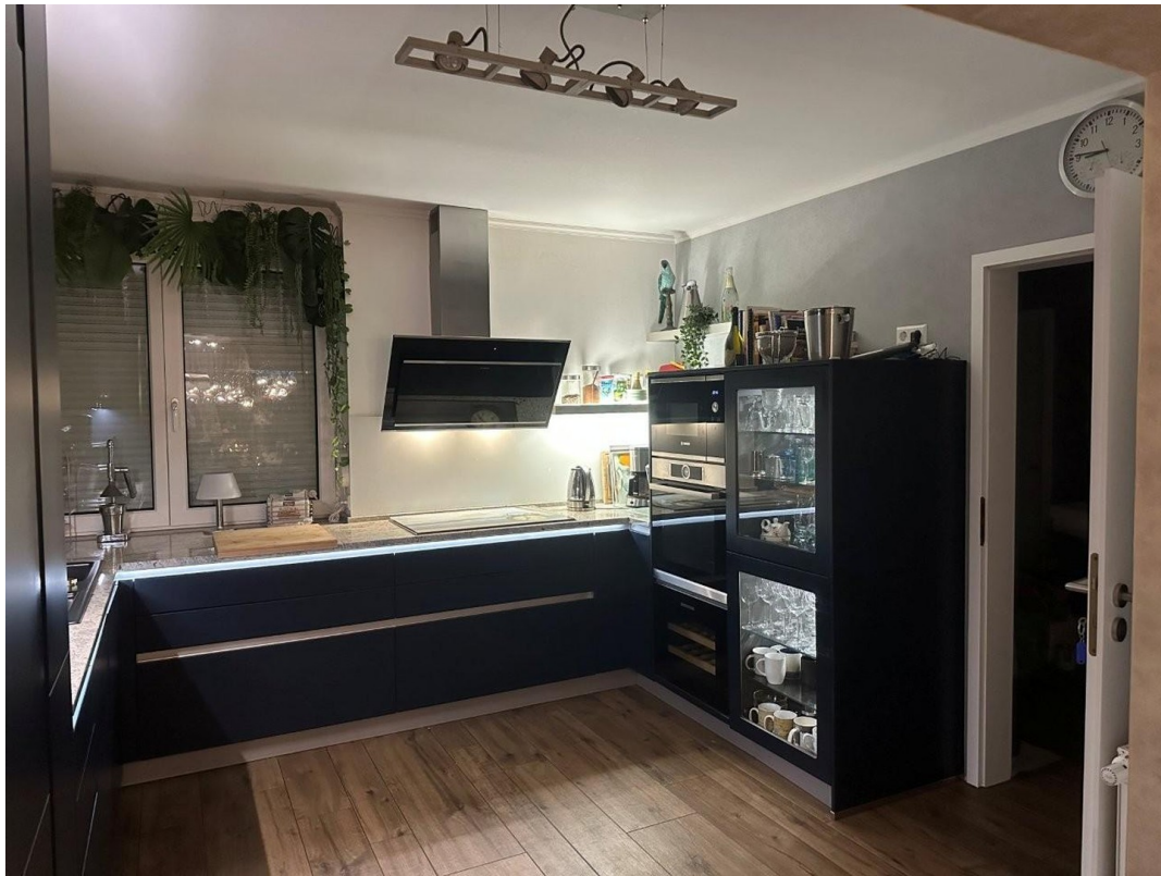
Einbauküche mit Durchgang