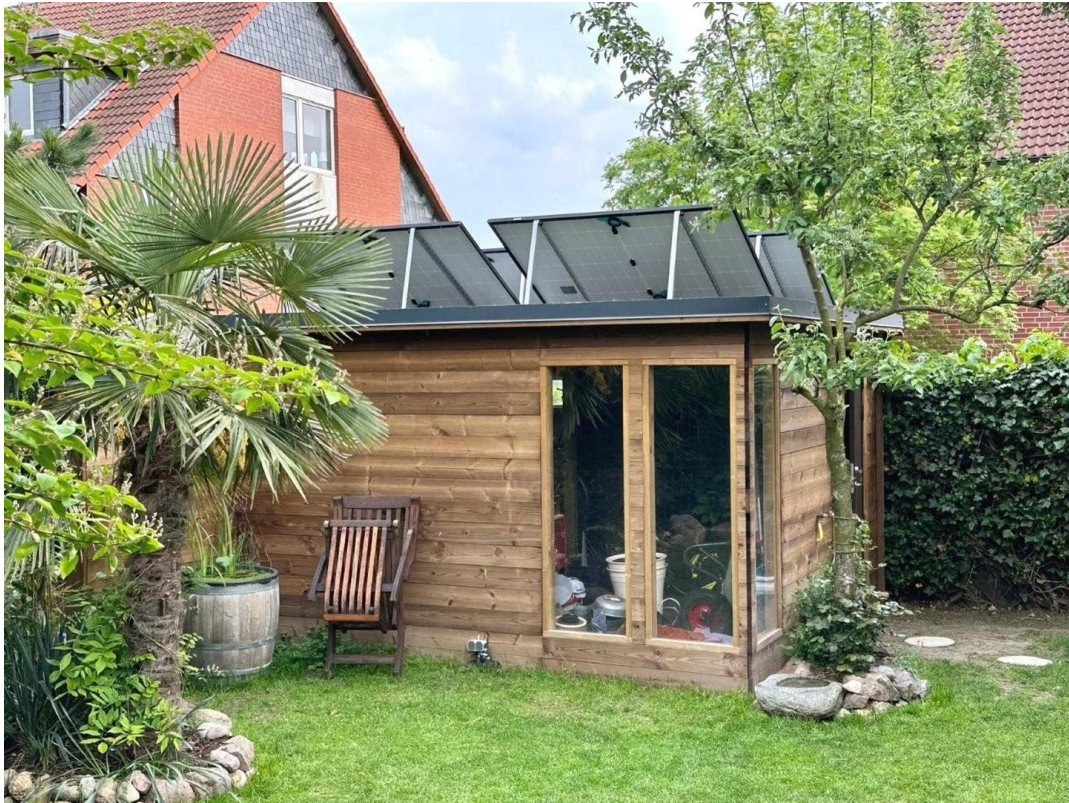
Gartenhaus mit Solarpanelen