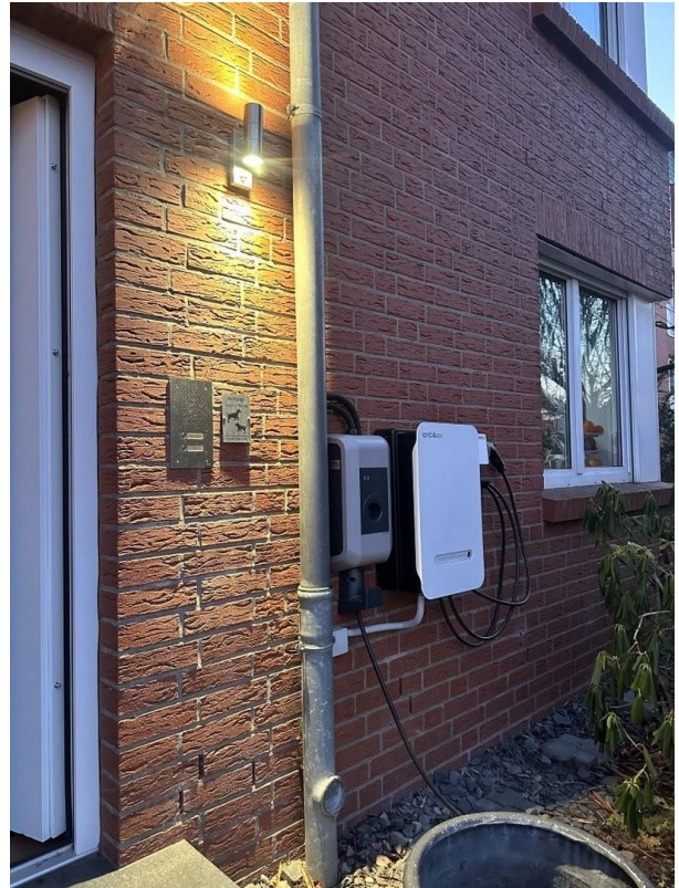
Wallboxen vor dem Haus