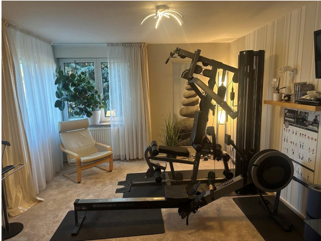
Trainings & Ankleide 1. OG