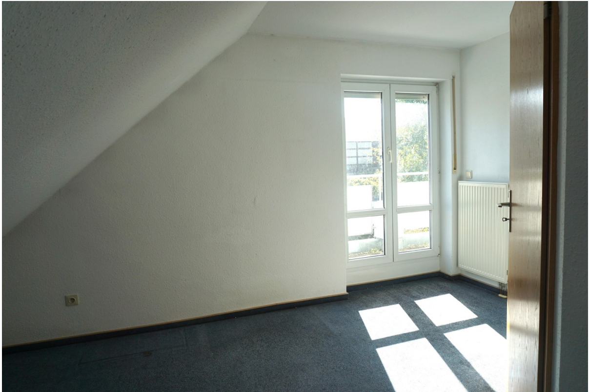
1. Kinderzimmer im DG