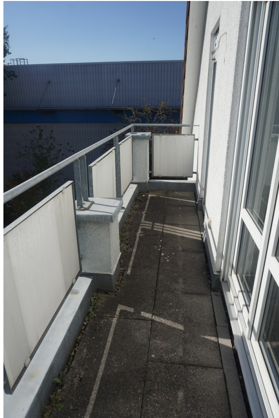
Balkon im DG