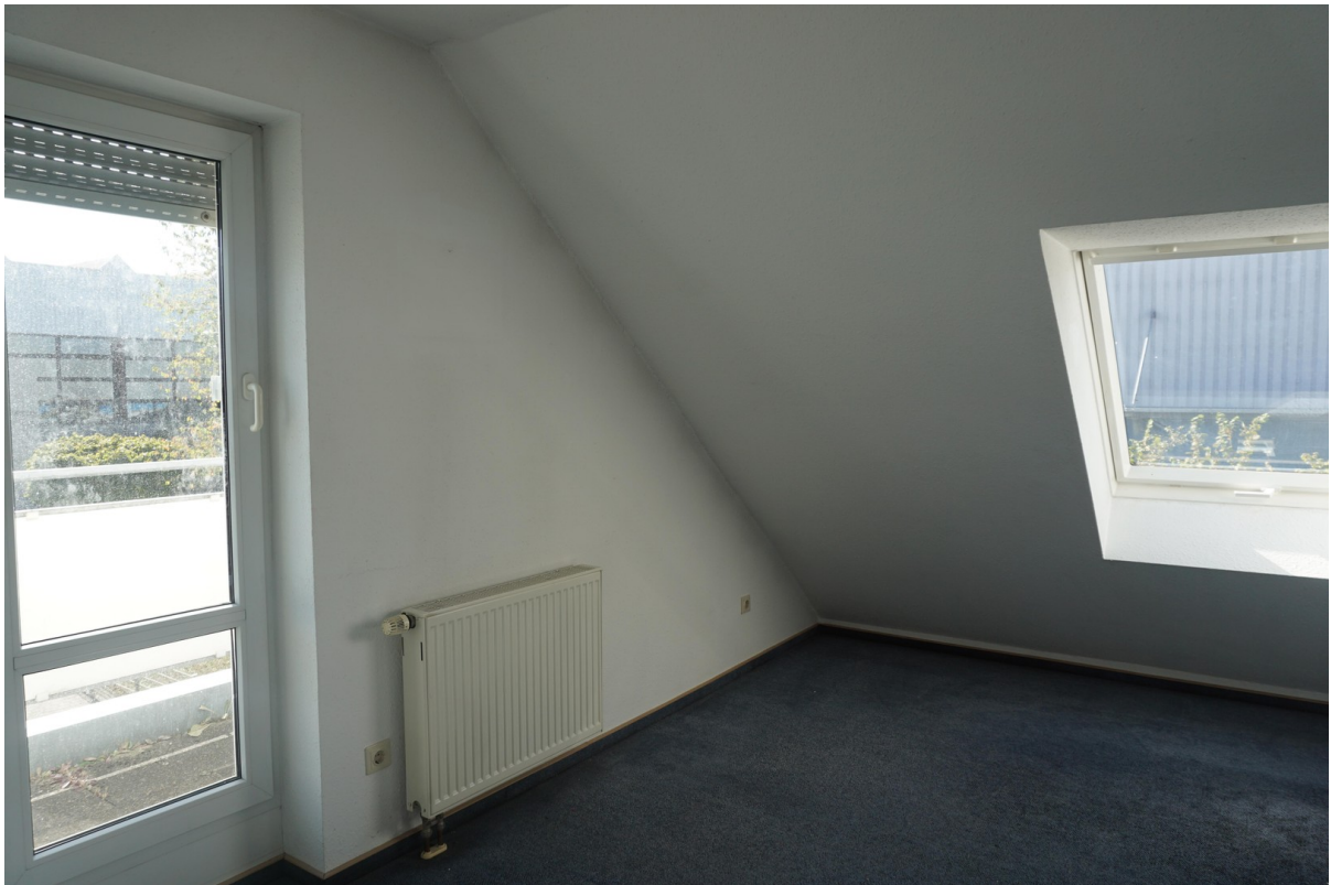
2. Kinderzimmer im DG