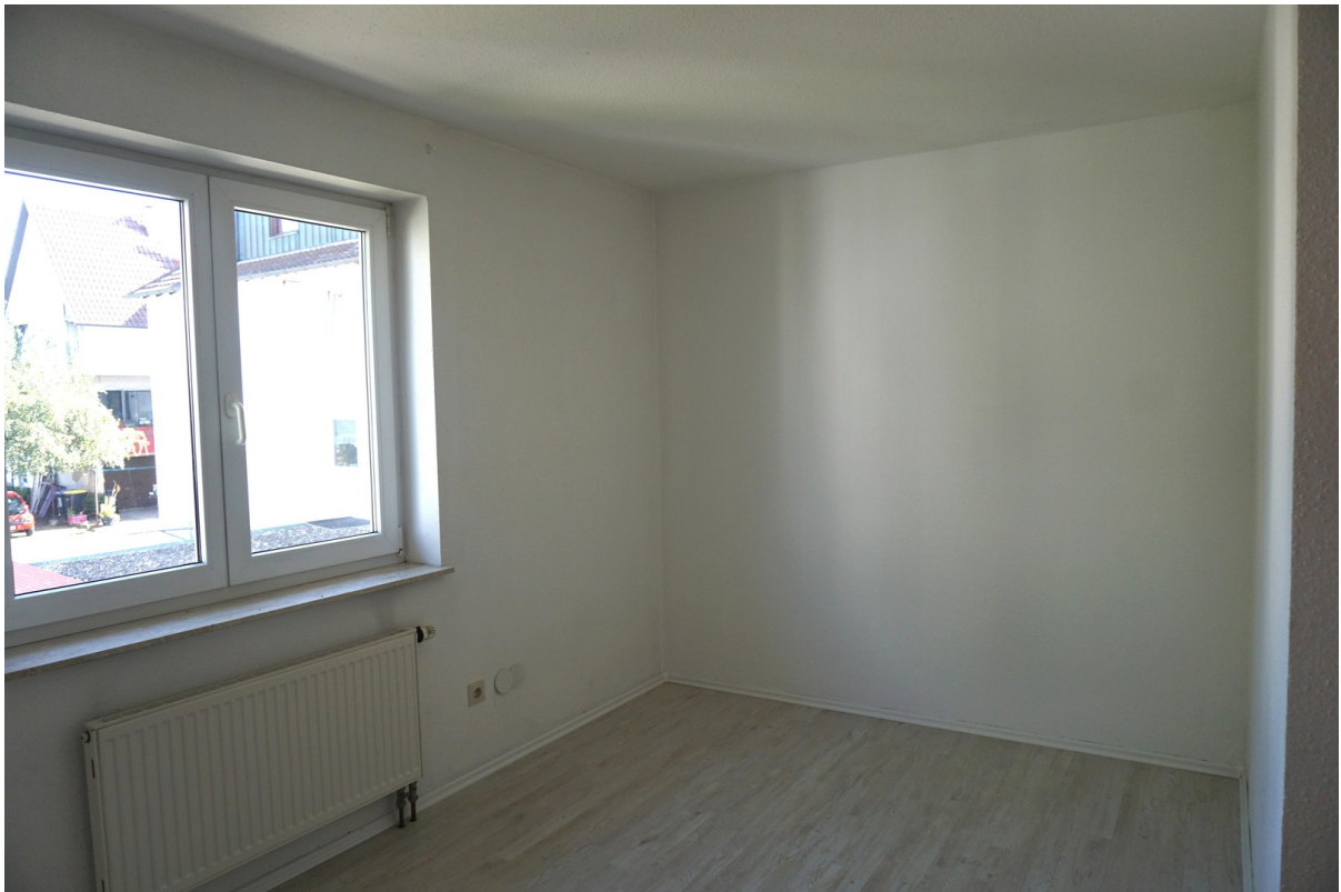
Kinderzimmer im OG