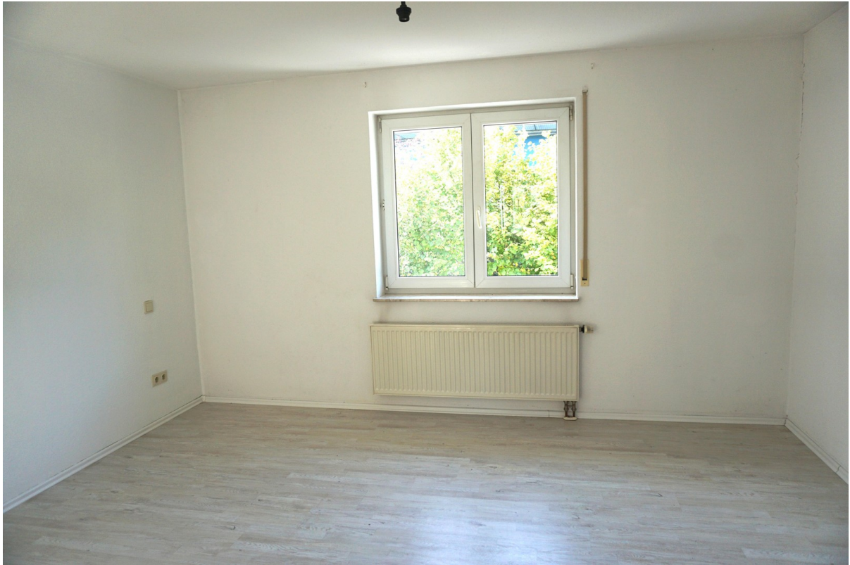
Elternschlafzimmer im OG