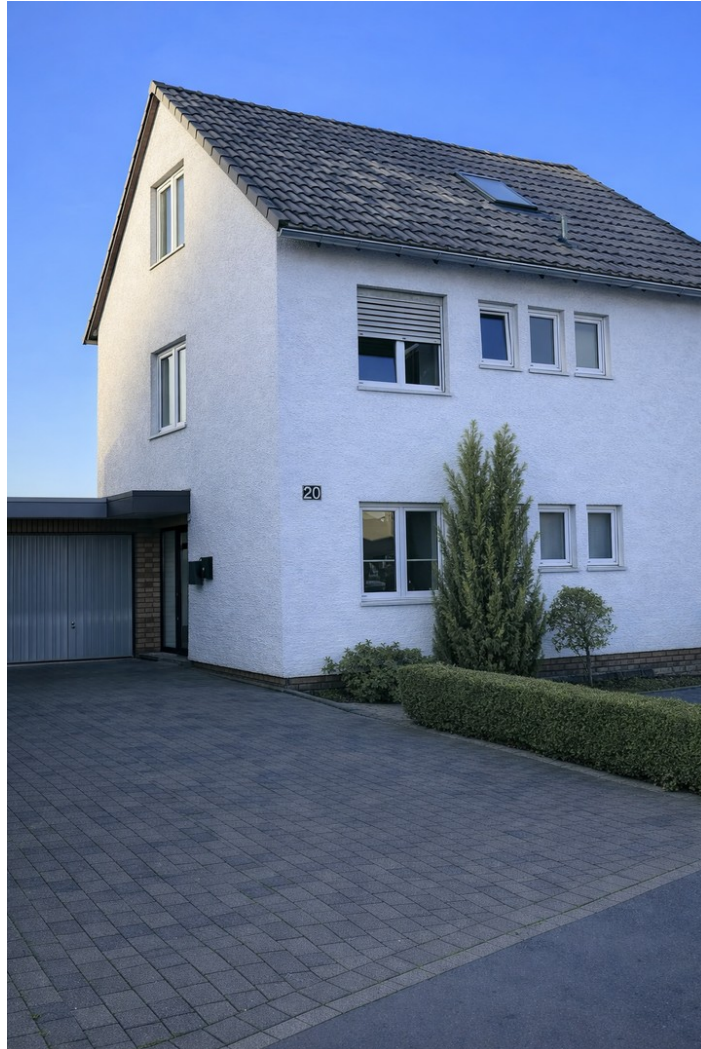
Hausfront Zugang Haustür