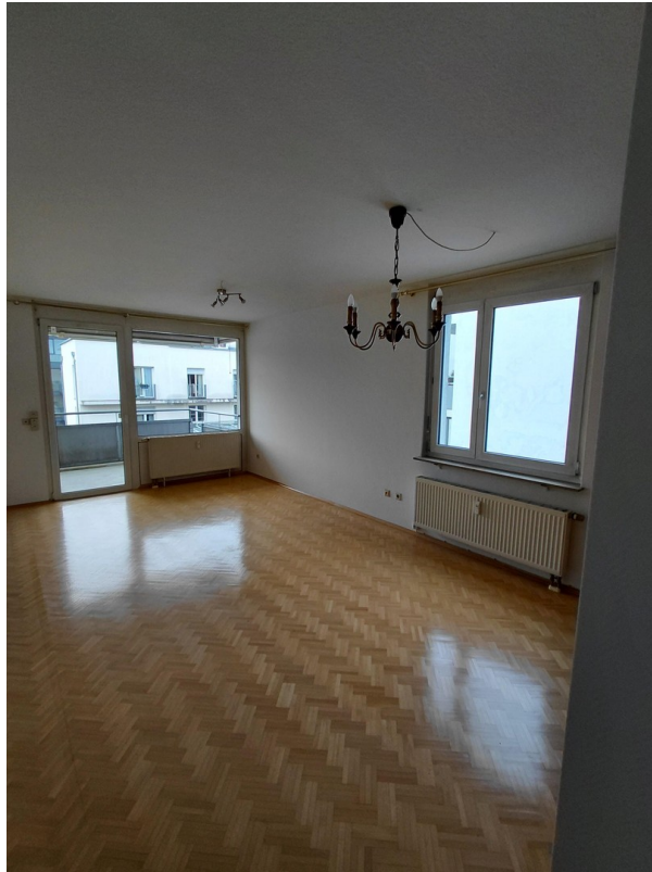
Wohnzimmer mit Essplatz