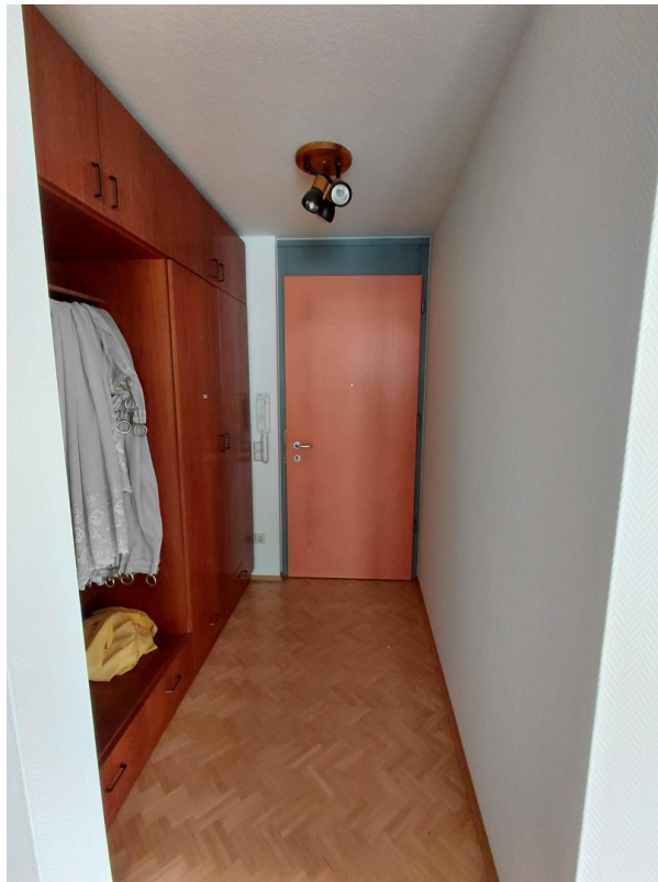
Eingang mit Gardrobenschränk