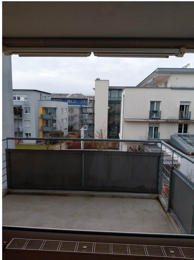
Blick von Balkon auf Pflegeheim