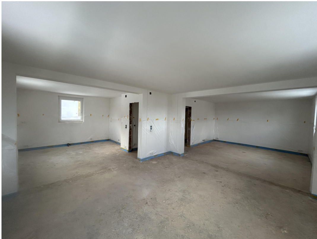
offener Wohn- und Essbereich