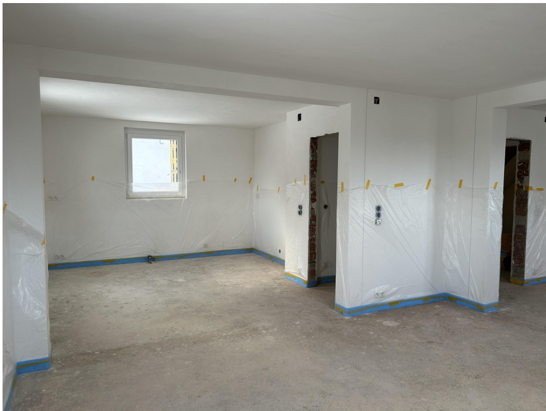
Blick Richtung Küche