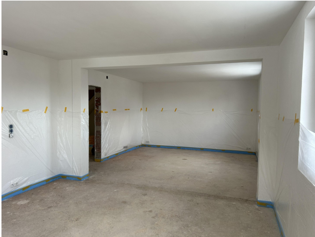
Blick Richtung Wohnbereich