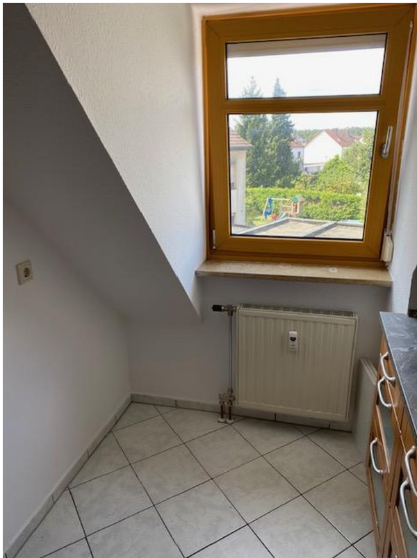
Blick aus der Küche