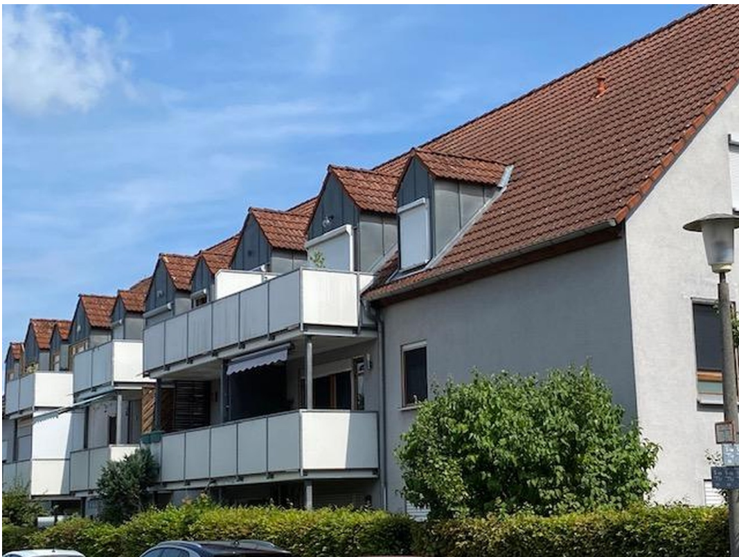
Blick auf Balkon