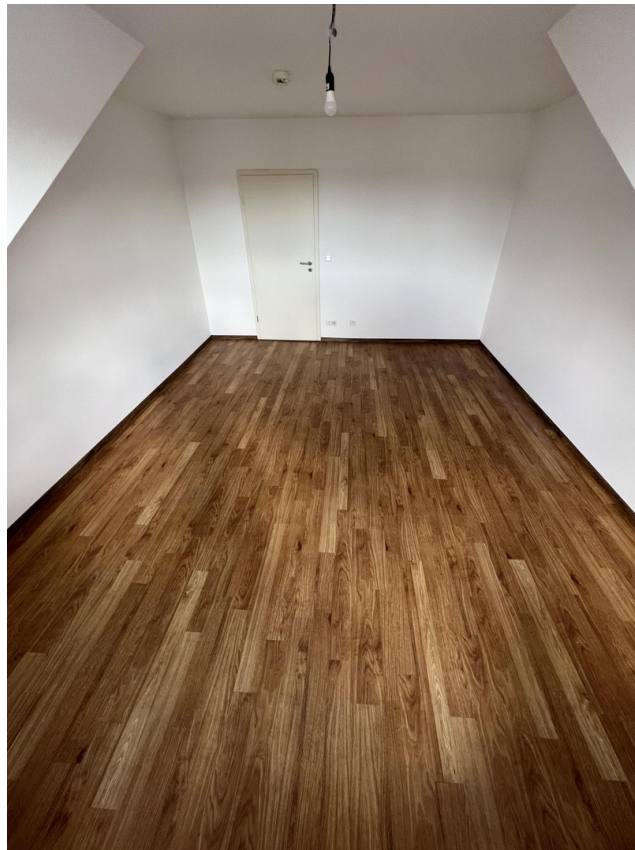
Wohn- und Schlafzimmer