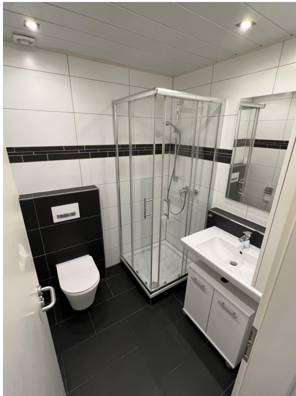
Modernes Badezimmer / Duschbad