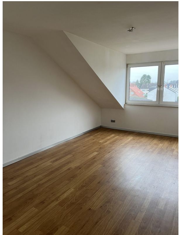
Wohn- und Schlafzimmer