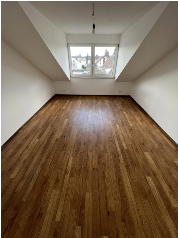
Wohn- und Schlafzimmer