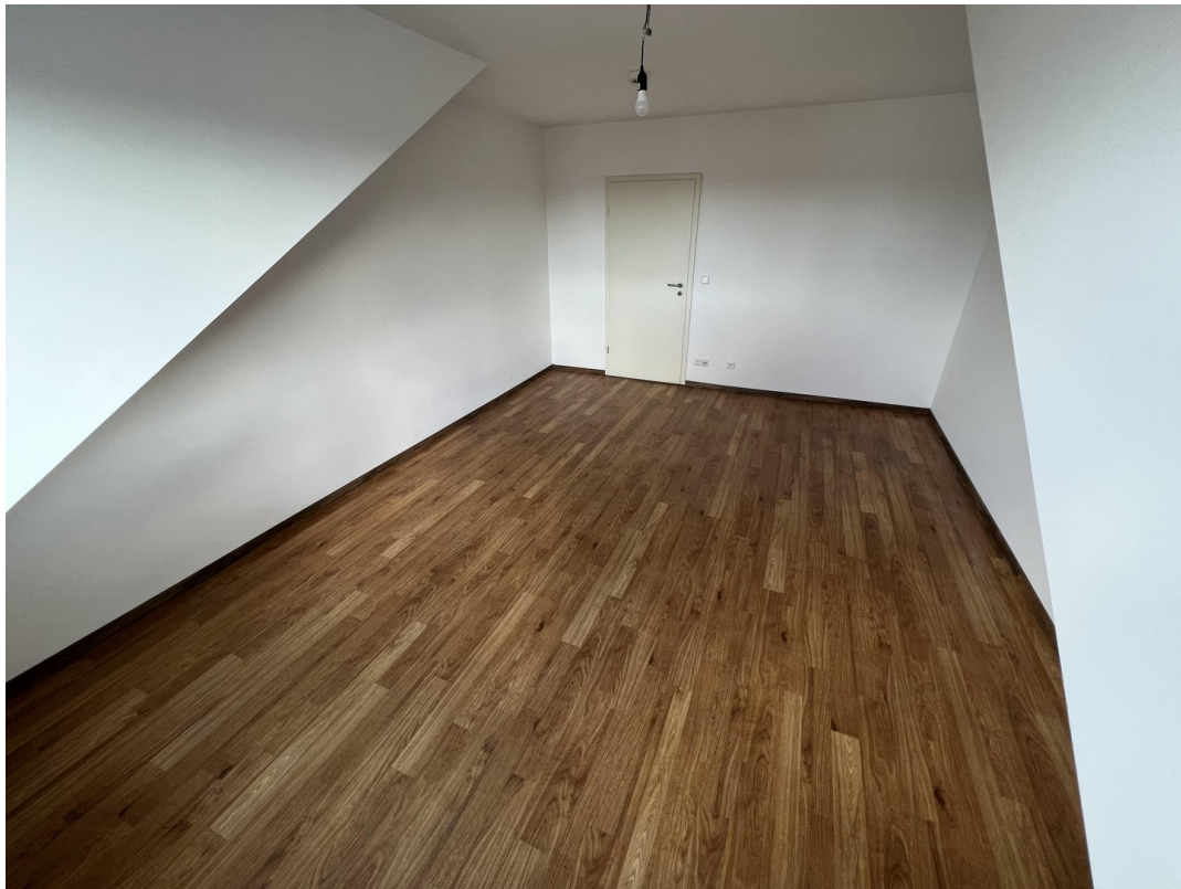
Wohn- und Schlafzimmer