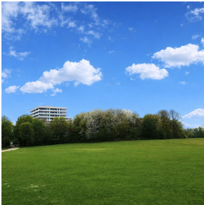
Haus Parkseite 1