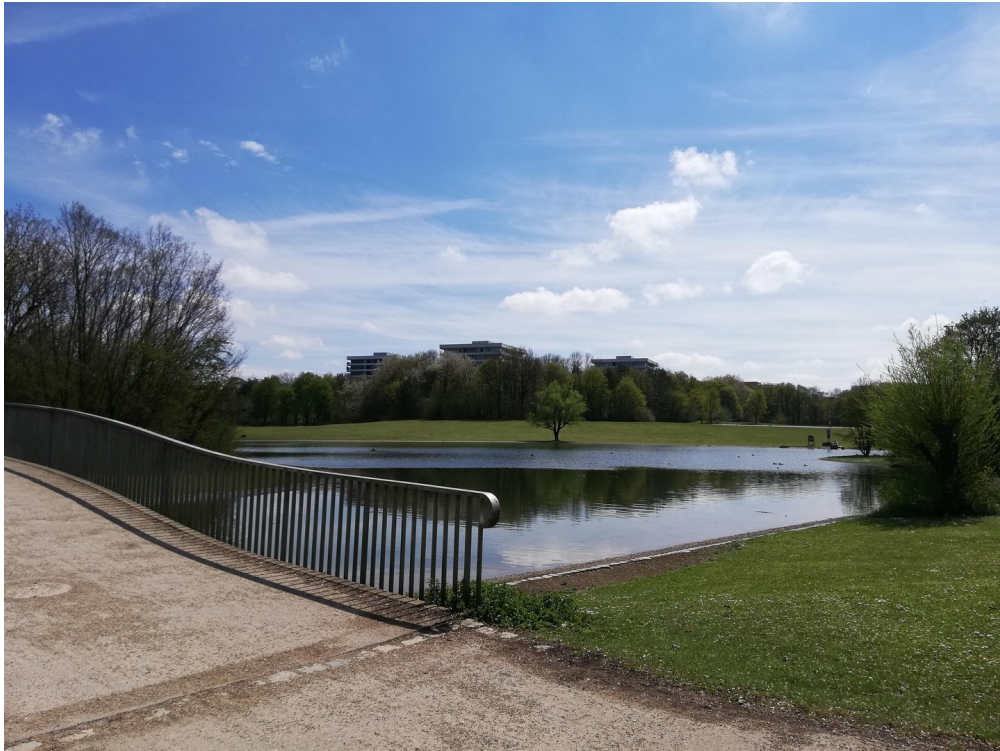
Haus Parkseite 2