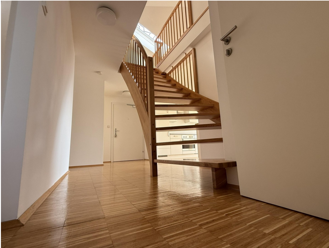
Eingangsbereich/ Stiege Galerie