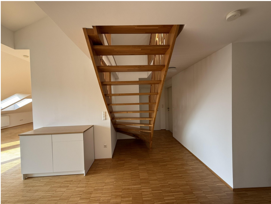
Eingangsbereich/ Stiege Galerie