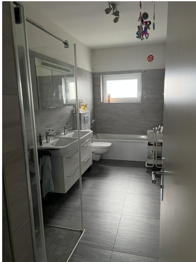
Bad / Erdgeschoss