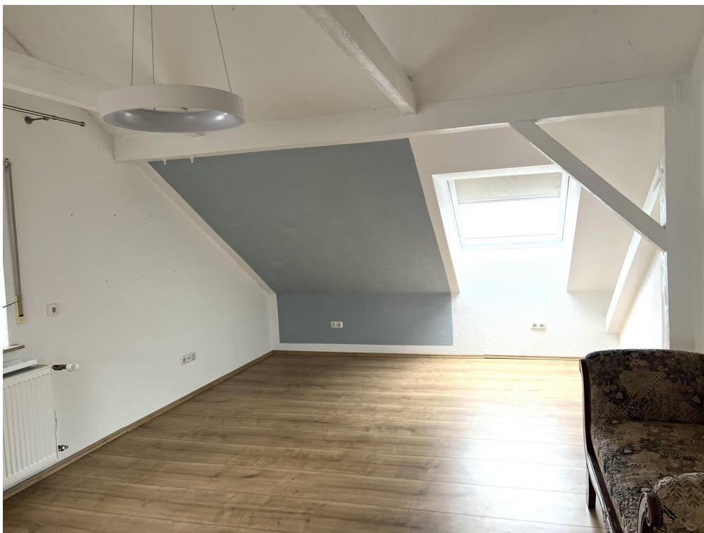
Dachzimmer mit Fernblick/2x