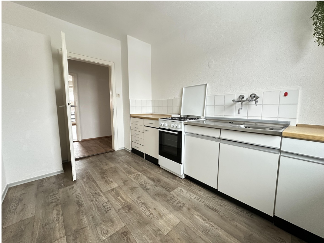
Küche mit Herd und Backofen