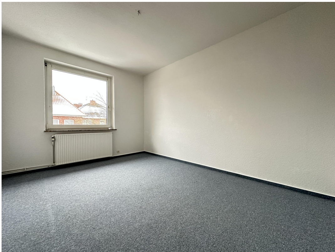
Kinderzimmer / Home Office