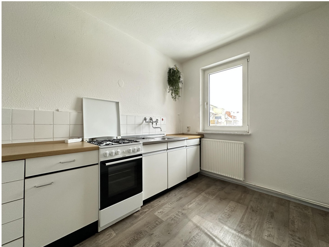
Küche mit Herd und Backofen