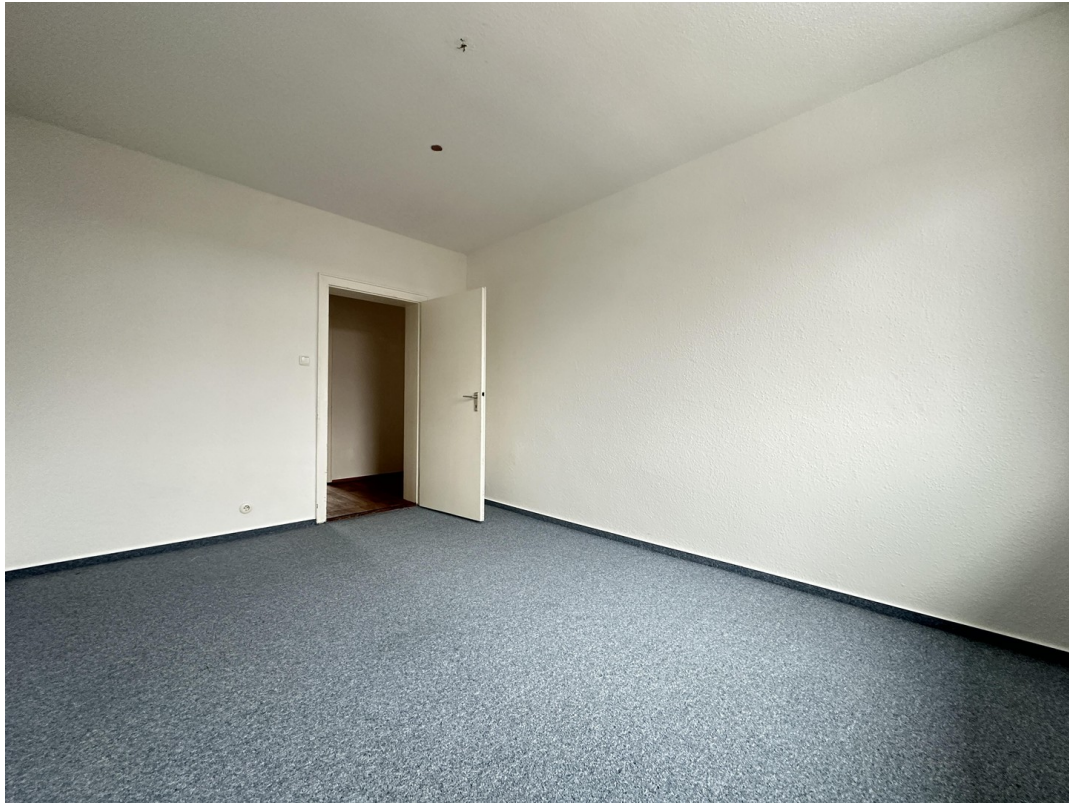
Kinderzimmer / Home Office