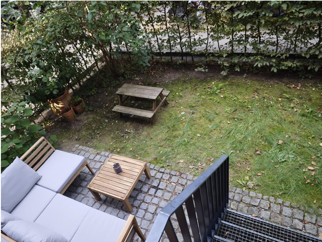
Blick auf die Sitzecke im Gart