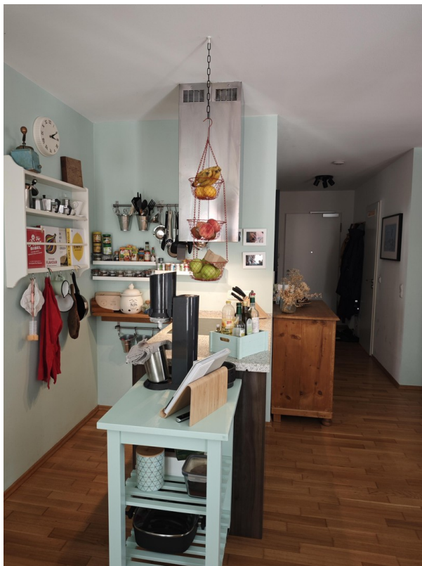
Eingangsbereich in die große W