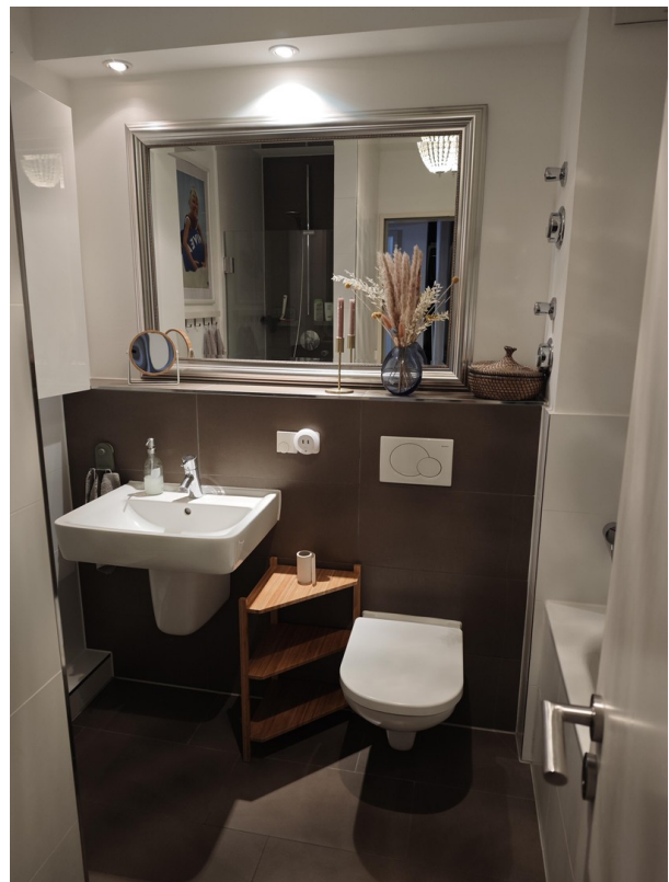
Badezimmer mit Dusche und Bade