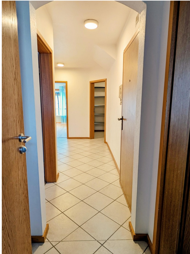
Flur Sicht 2