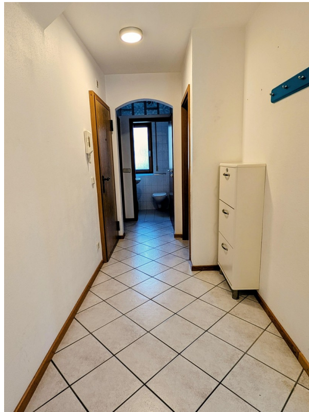
Flur Sicht 1