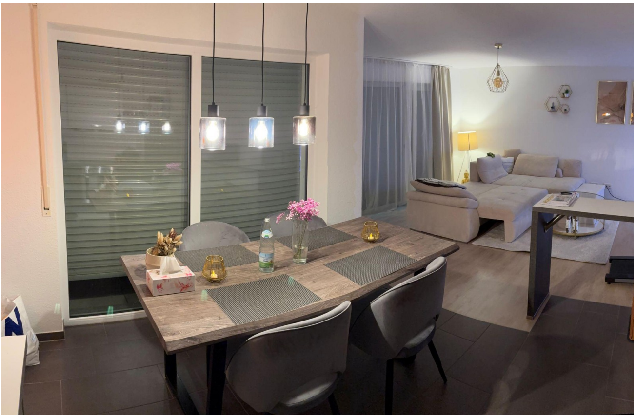
Essen - Wohnen