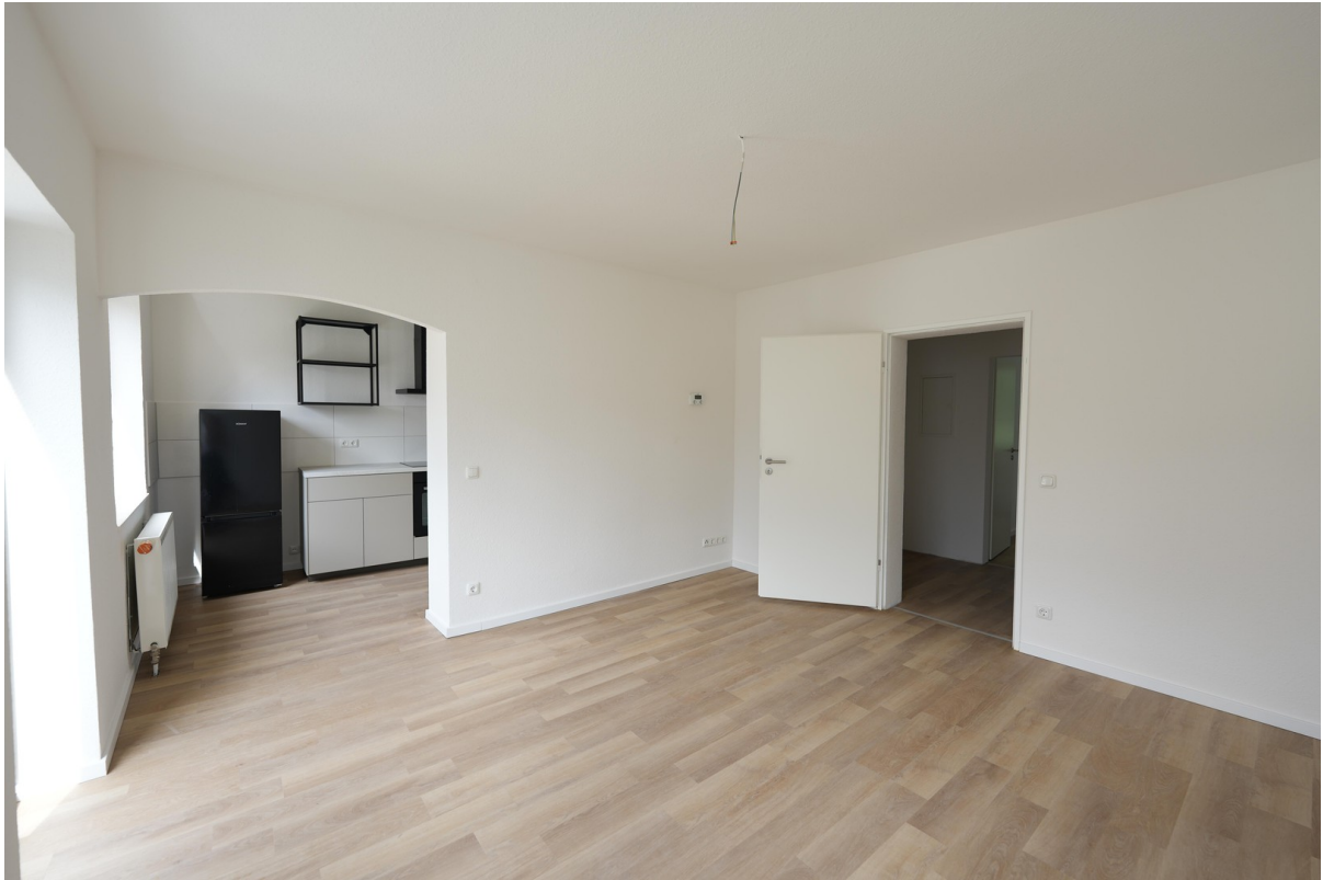
Wohnzimmer während Renovierung