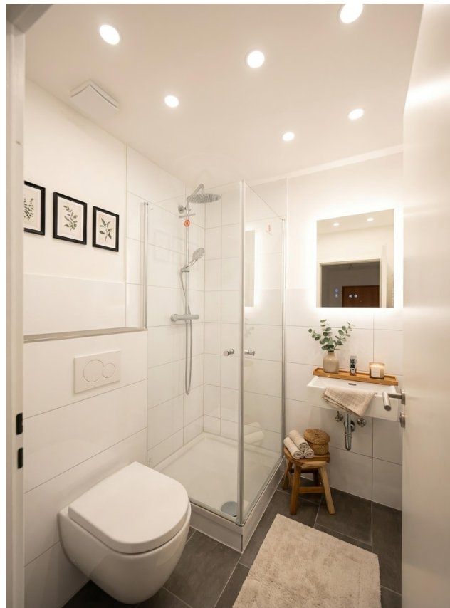
Digitale Deko/Möbel Bad