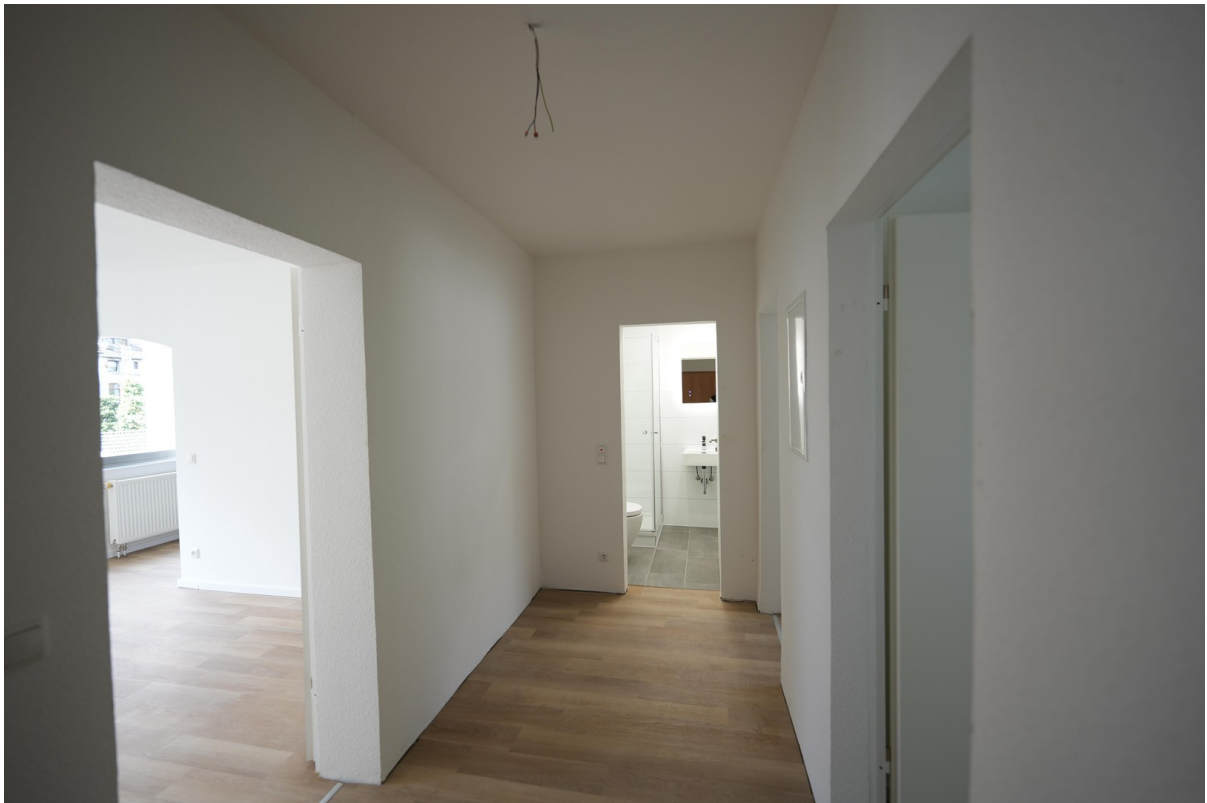
Flur bei Renovierung