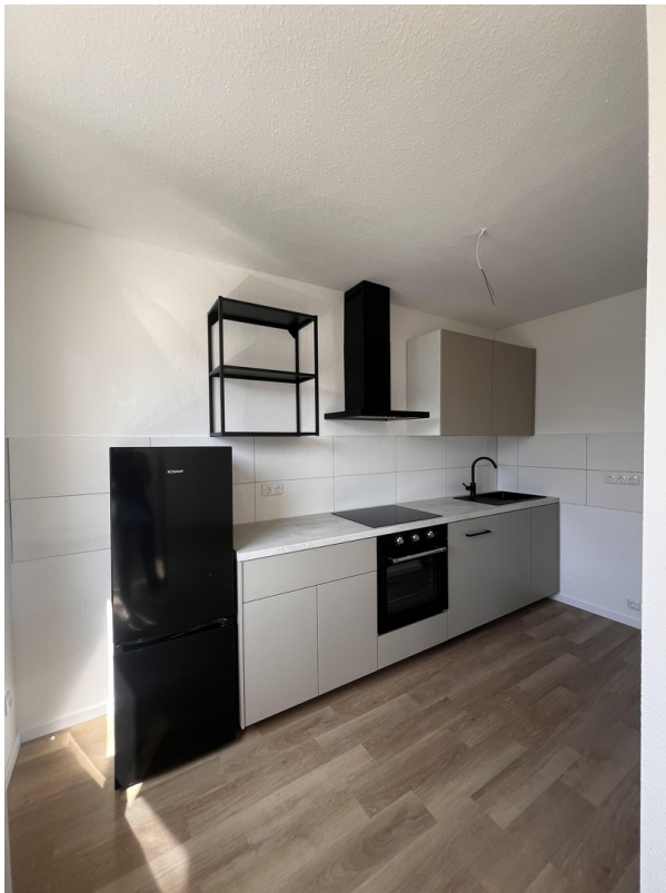
Küche mit Elektrogeräten