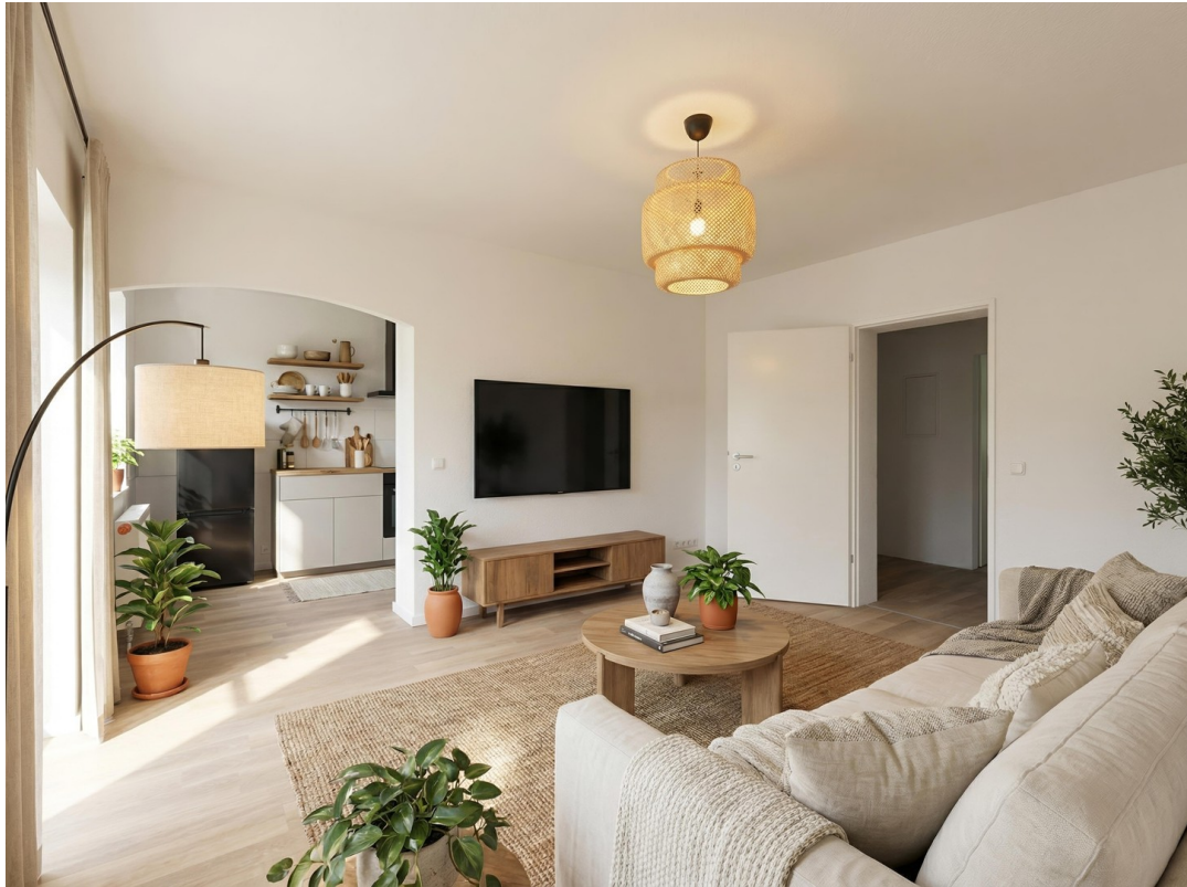
Digitale Deko/Möbel Wohn/Küche