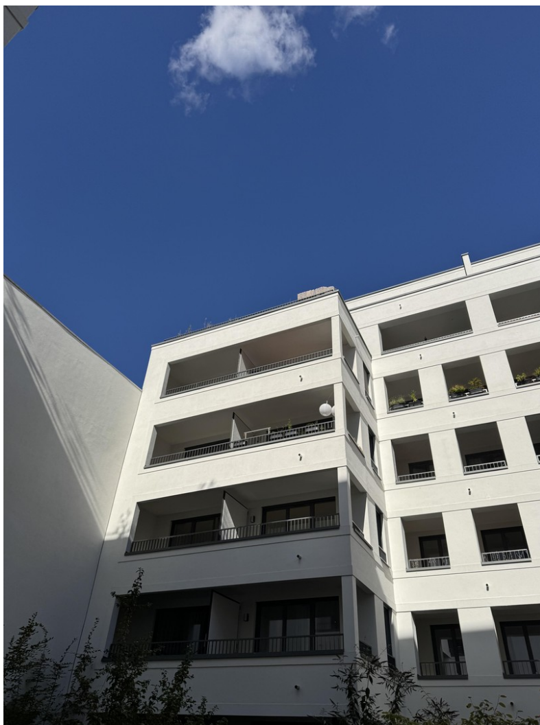
Ansicht Wohnung außen